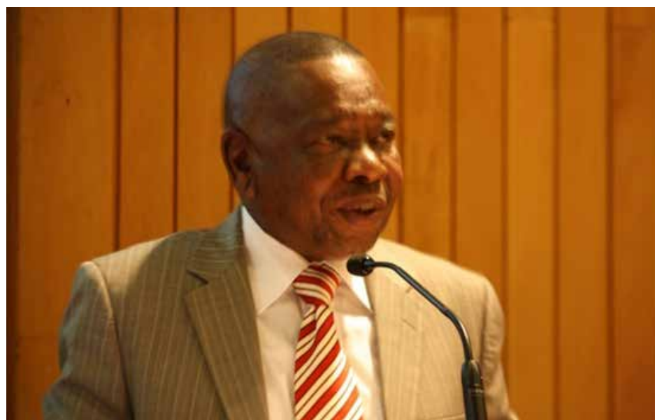
السكرتير العام للحزب الشيوعي في جنوب افريقيا بلايد زاميندي

شغلت نتائج الانتخابات المحلية التي جرت في تشرين الثاني حيزاً واسعاً من التقرير. لقد فقد حزب المؤتمر الوطني الأفريقي، أغلبيته المطلقة لأول مرة منذ نهاية نظام الفصل العنصري قبل 27 عاماً، وحصل الحزب على 46 في المائة من الأصوات على الصعيد الوطني فقط، بخسارة قدرها قرابة 8 في المائة، مقارنة بالانتخابات المحلية السابقة. وارجع الزعيم الشيوعي هذه النتيجة الى انخفاض نسبة المشاركة في التصويت، نتيجة لارتفاع البطالة والفقر، وعدم كفاية إمدادات المياه والكهرباء، وسلسلة قضايا الفساد التي يشارك فيها سياسيو حزب المؤتمر الوطني الأفريقي، وبالتالي فقد العديد من مواطني جنوب إفريقيا الثقة في العملية الديمقراطية.