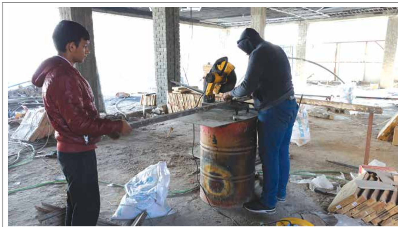
عمالة الاطفال.. متى تطبق المادة (95) من قانون العمل المرقم (37) لسنة 2015؟