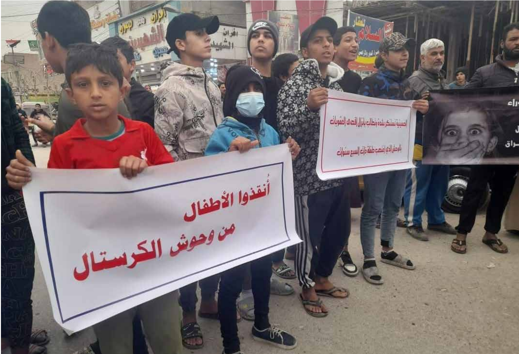
وقفة احتجاجية في قضاء الحسينية ببغداد للمطالبة بمكافحة آفة المخدرات

تعد مشكلة المخدرات في المجتمعات كافة، وخاصة في مجتمعنا العراقي، من المسائل المتجددة وذات الأثر المركبة، والتي تشكل تحدياً خطيراً يتسع ويتنامى كل يوم، فيفتك بالارواح والأسر ويضعف دور الشباب ويسبب أضراراً نفسية وأخلاقية واجتماعية لهم، فيما تستثمر بعض أموال هذه التجارة القذرة في تمويل أنشطة إجرامية كالإرهاب وغسيل الاموال والهيمنة على مصائر الشعوب وسلب أو تحجيم الإرادة الحرة للدول الوطنية، بالإضافة الى تحطيم الركائز والمصالح الاساسية التي تقوم عليها حياة المجتمع، والسبل التي يجب أن يسلكها لتحقيق التنمية والتقدم العلمي والحضاري. وبغية تسليط الضوء على جرائم المخدرات واثارها، فضلا عن التحديات التي تواجهها المجتمعات في مسار مجابتهها، بادر مركز بغداد للتنمية القانونية والاقتصادية، الى عقد ندوة تحت عنوان ( تحديات مواجهة المخدرات وانعكاساتها على التنمية في العراق)، وذلك لتعزيز شعار (عالم بلا مخدرات في متناولنا) وتوضيح خطر تعاطي المخدرات والإدمان عليها وبيان انعكاساتها على المجتمع من مختلف الجوانب الاقتصادية والقانونية والنفسية والاجتماعية. وتولى ادارة الندوة التي تضمنت اربعة محاور، البروفيسور ام كلثوم صبيح محمد: