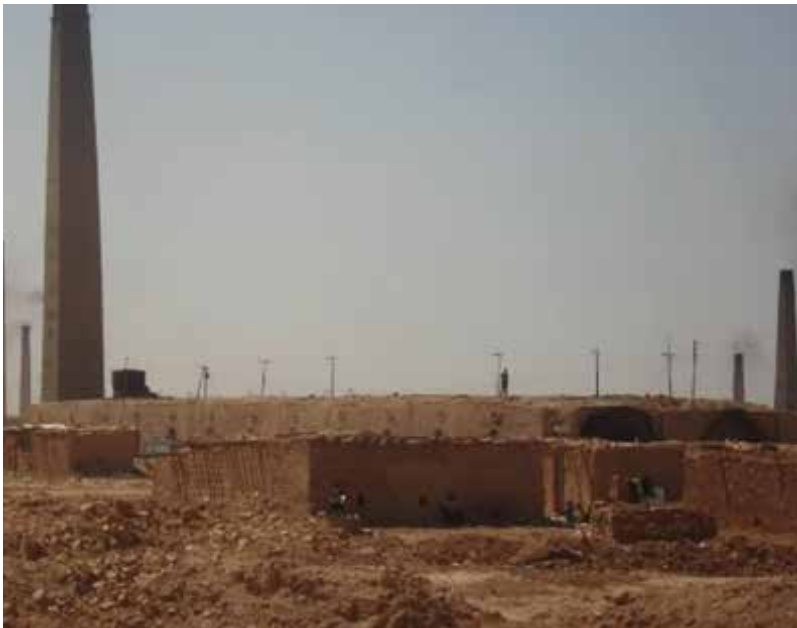
68 معمل طابوق أغلقت بسبب نقص الوقود

تعمد عليه في تشغيلها، فضلا عن افتقار المحافظة لمعامل تكرير النفط، إلى جانب الاستيراد العشوائي للطابوق من بعض دول الجوار، ما جعل هذه المعامل غير مجدية اقتصادياً.