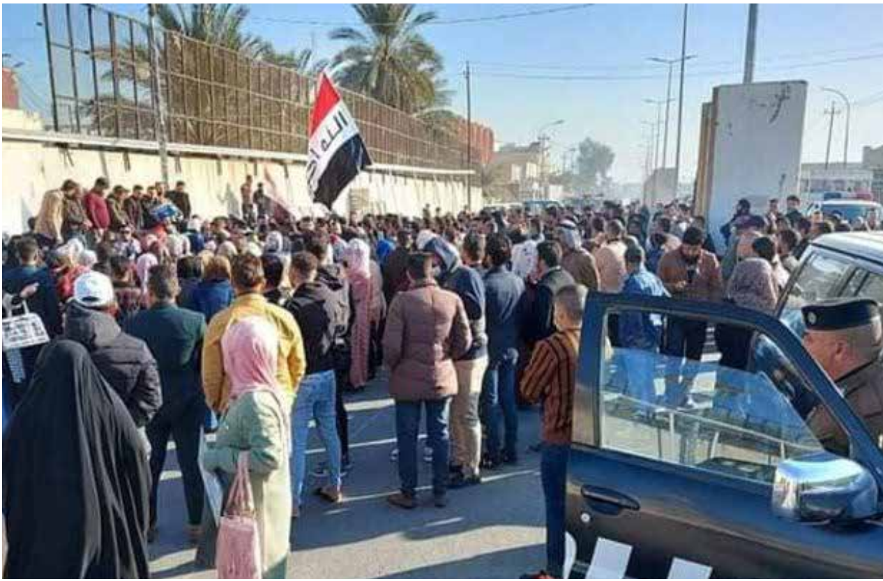
المحاضرون يهددون بتصعيد أكبر إذا لم تستجب الحكومة لمطالبهم

سنوات، وذلك بعد تحديد مساحة 30 دوغا من قبل البلدية وعدم توزيعها حتى الآن. وقال عدد منهم عبر منصات التواصل الاجتماعي إن "المواقفات الخاصة بهم لم تصدر حتى الآن على الرغم من مراجعتهم المستمرة منذ 5 سنوات، واستكمال الموافقات القانونية والرسمية"، داعين إلى "عدم التسوية وإبعاد هذا الملف عن اي تلاعب قد يؤدي إلى عدم شمولهم بالتوزيع أسوة بأقرانهم في المحافظات الأخرى".