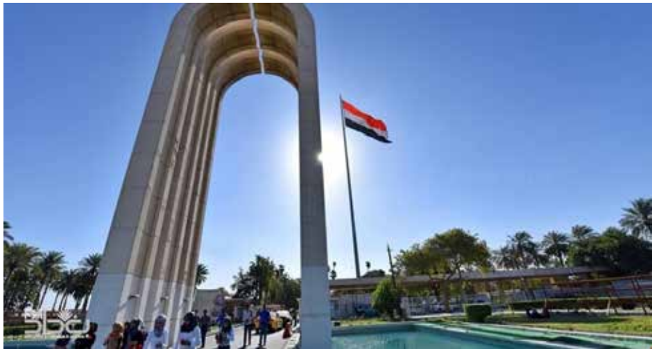
طلبة وعوائلهم: جهات متنفذة وراء بقاء نظام القبول المركزي بصورته الحالية

القبول في قسم الانسجة الطبية انخفض من 97 الى 60 بسبب تحويل القسم الى كلية الزراعة.