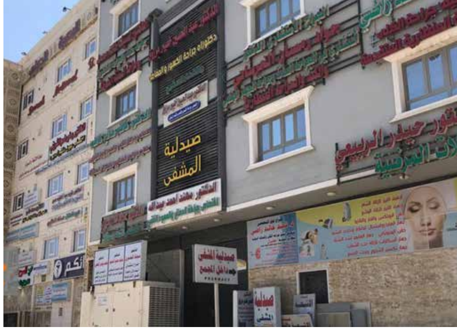
مواطنون: أزمة قطاع الصحة تتفاقم والحلول غائبة

ولا يتجند عودة مراجعة الأطباء في المستشفيات