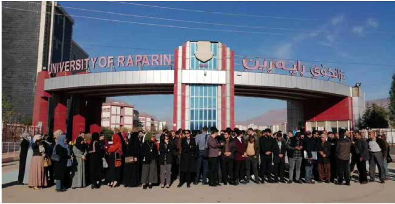
الكوادر الإدارية والتعليمية يتظاهرون أمام مبنى رئاسة جامعة رابرين في السليمانية

ونظم العشرات من اصحاب الأجور اليومية والعقود في مديرية بلدية الديوانية اضراباً عن الدوام.