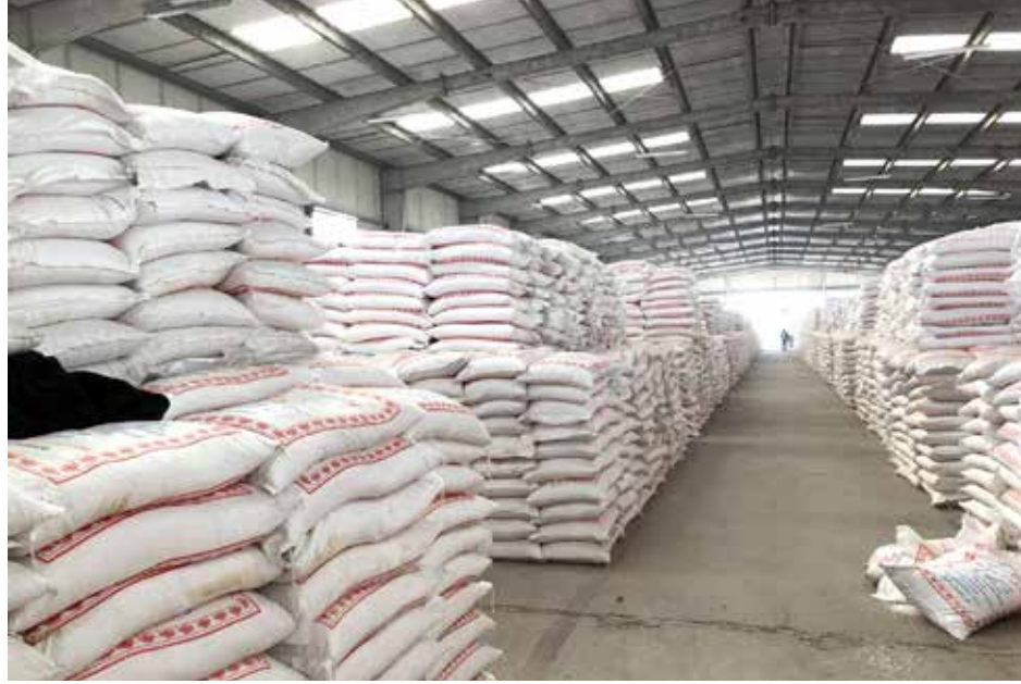
أزمة نقص الطحين تتكرر.. ما السبب؟

وفي هذا السياق، يقول وزير التجارة الاسبق والمرشح الفائز في الانتخابات، محمد شياع السوداني لـ "طريق الشعب"، ان "ارتفاع اسعار القمح في الاسواق العالمية مبعث قلق ازاء العراق، خاصة وان الحكومة عملت مؤخراً على تقليص الخطة الزراعية، نتيجة لقلّة الإيرادات المالية من دول الجوار". وأشار الى "النقص الحاد في مادة الاعلاف الحيوانية، دفع مربي الثروة الحيوانية الى استخدام الطحين كعكف للحيوانات"، محذراً من ان "بقاء الوضع على ما هو عليه، يؤدي الى ارتفاع اسعار الطحين في الاسواق الى اضعاف ما هي عليه اليوم، فضلاً عن شحة توزيعه في البطاقة التموينية". وبخصوص