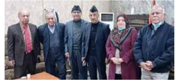
شيوعيو الكاظمية يزورون دوائر حكومية