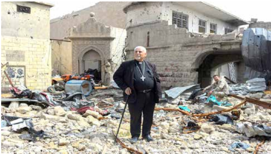
مسيحيو العراق يطالبون بقانون يعيد أملاكهم المسلوقة

وأضاف فرات أن "التهميش والاقصاء وسلب الحقوق الذي يعيشه المسيحيون، هو عملية ممنهجة". وأشار فرات إلى أن "هذه السلوكيات هي ما دفع معظم المسيحيين الى اتخاذ قرار الهجرة، ومن بقي في البلاد يرغب في الهجرة لكن الفرصة لم تتوفر له بعد".