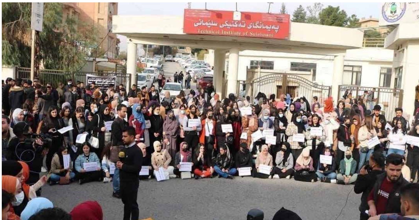
طلبة السليمانية يواصلون احتجاجهم

اغلق مبنى الحكومة المحلية، للمطالبة بتوفير فرص العمل.