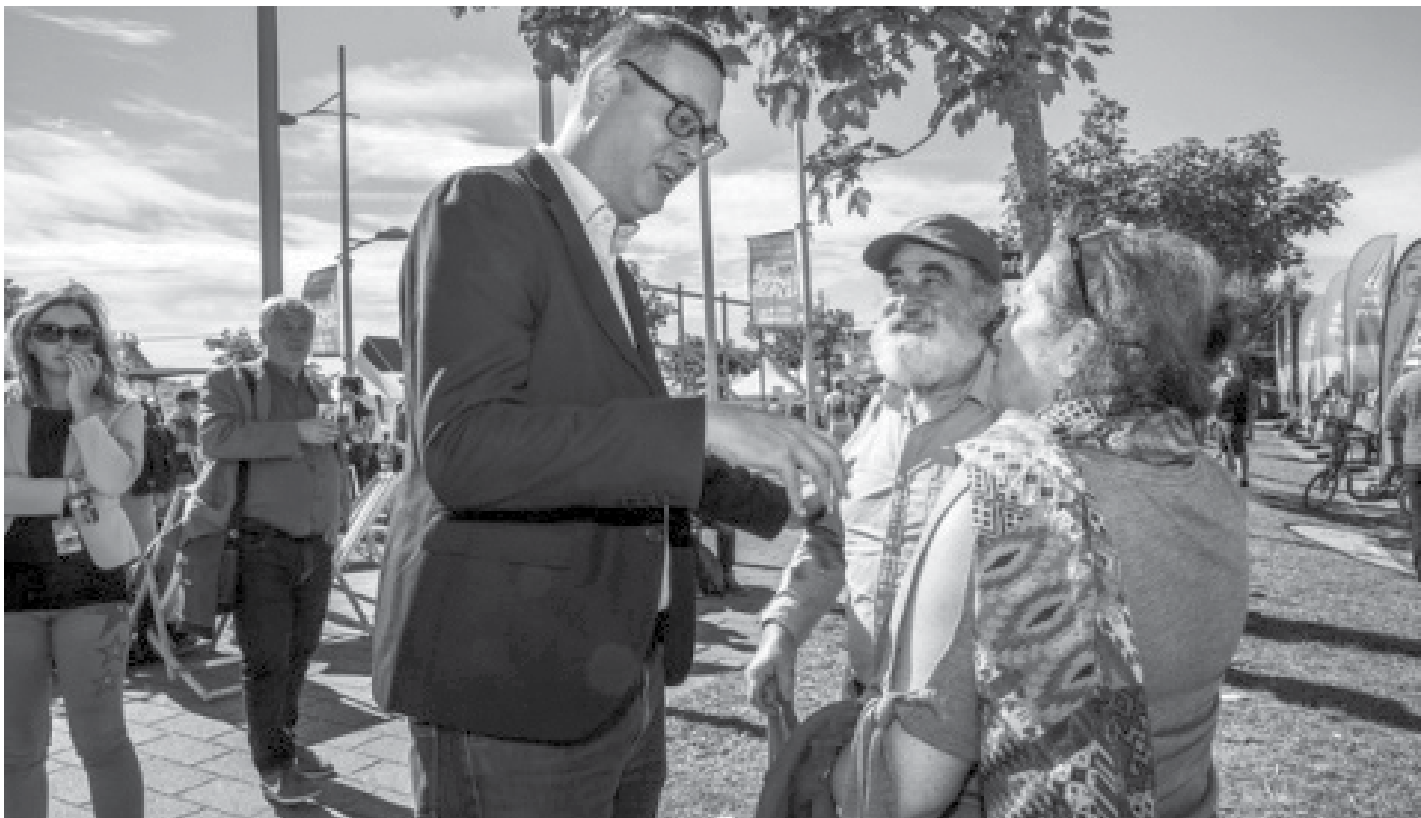
زعيم الحزب الجديد في حديث مباشر مع الناخبين

البيميني. وكل من يريد بناء عالم آخر. نريد أن يكون لهم مكانهم في حزبنا وفي منظماتنا الشبابية".