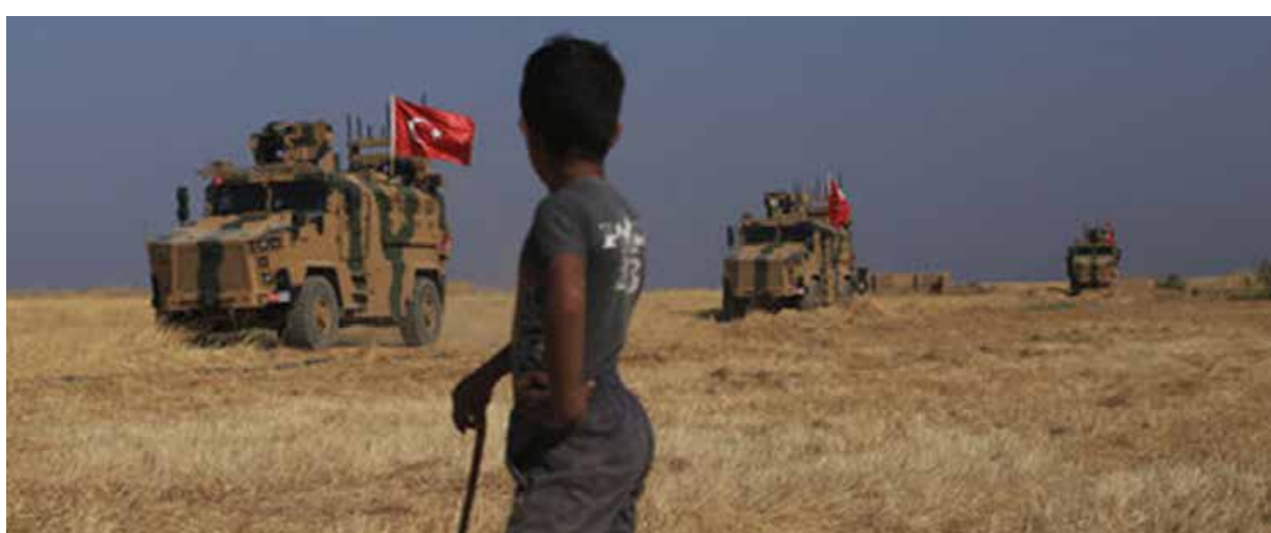
حروب أردوغان وسيلة لادامة تدفق اللاجئين

وأشار المسؤول الفلسطيني إلى أن اللجنة الرابعة في الجمعية العامة للأمم المتحدة ستصوّت، غدا الثلاثاء، على مشاريع القرارات