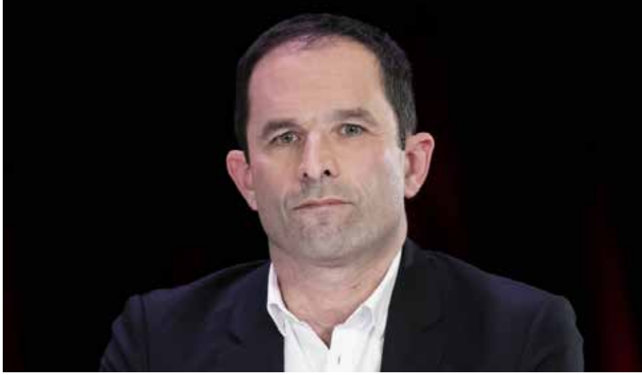
هامون دعا إلى اتفاق اليسار

لا شك أن الديمقراطية في فرنسا تمر بأزمة اليوم. و ردود اليسار ما زالت محصورة بملف المؤسسات، يقول اليسار: "علينا تغيير الدستور، علينا تغيير قانون الانتخابات، علينا تغيير الشروط المرتبطة بالمناصب الرئاسية". يمكن أن تكون مثل هذه الإجراءات مطلوبة، ولكن يجب ان يسير التفكير في التحول الديمقراطي إلى أبعد من ذلك، ليشمل معالجة اختلال توازن القوى بين مالكي الشركات والأسهم من ناحية، والعاملين بأجر، وجميع الأطراف ذات الصلة مثل الإدارات المحلية والمواطنين من ناحية أخرى. لكن اليسار لا يطرح اليوم، إضفاء الطابع الديمقراطي على الاقتصاد بالقدر الكافي.