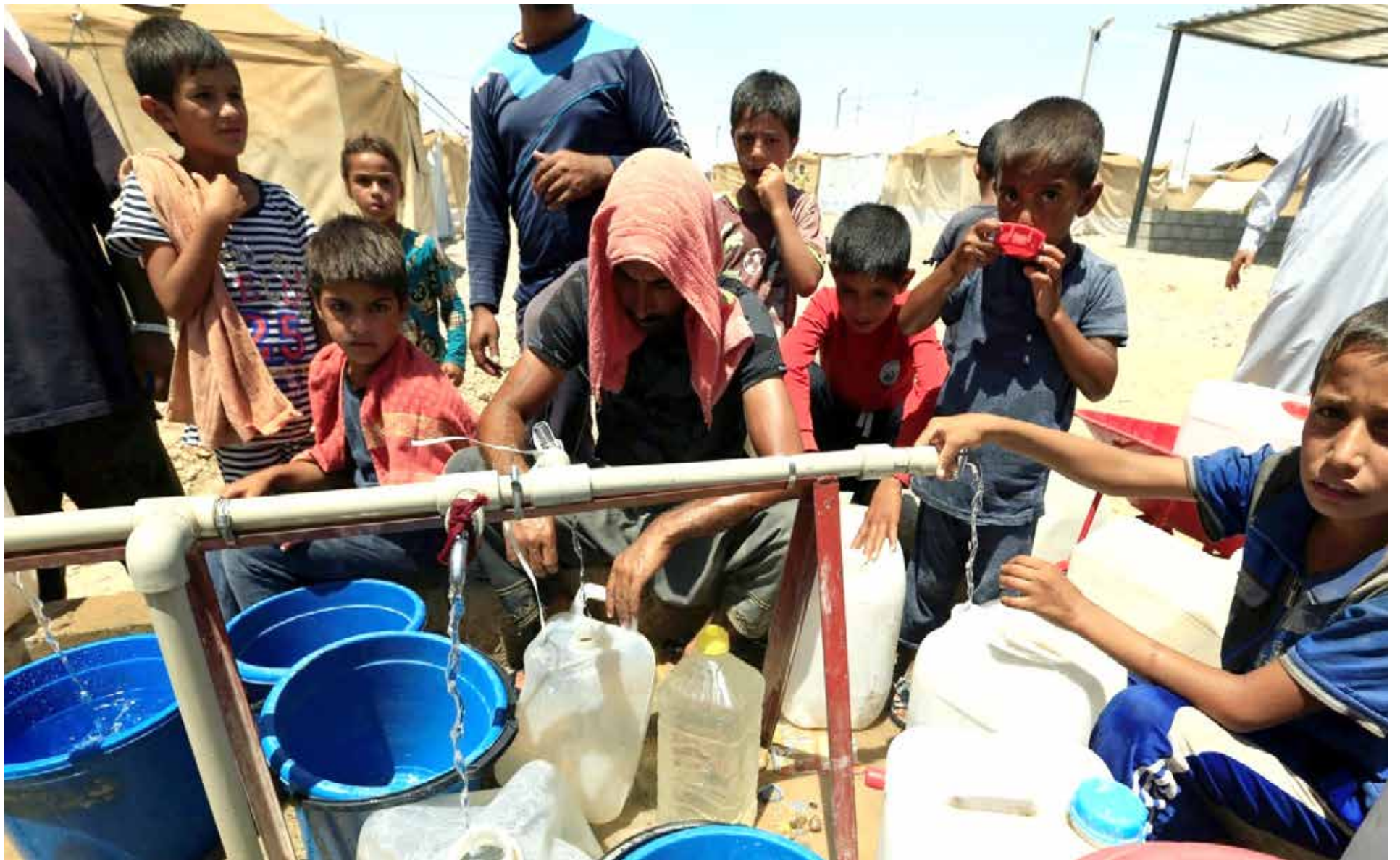
مناطق واسعة في العراق تعاني من نقص المياه الصالحة للشرب

وتوصي عدد من الدراسات والبحوث العلمية بـ"معالجة الآثار السلبية لتغير المناخ واتخاذ إجراءات للتكيف معه لضمان الأمن الغذائي، وتركيز البحث العلمي على استشراف الآثار المستقبلية للتغيرات المناخية وكيفية مواجهتها، والاتجاه إلى الاستثمار الجاد في المياه الجوفية، خاصة في مناطق الخزين المتجدد التي تتميز بخصوبة أراضيها".