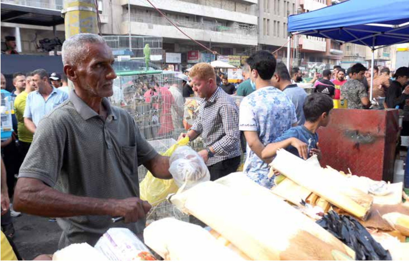
ما مر عام والعراق ليس فيه جوع

امتلاك السلع المعمرة (أو الدائمة) والأصول المادية الأخرى، وفقدان القدرة على مواجهة الحالات الصعبة كالمرض والإعاقة والبطالة والكوارث والأزمات. أي أنه يتجلى في عدم القدرة على تحقيق مستوى معين من المعيشة المادية يُثقل الحد الأدنى المعقول والمقبول في مجتمع ما".