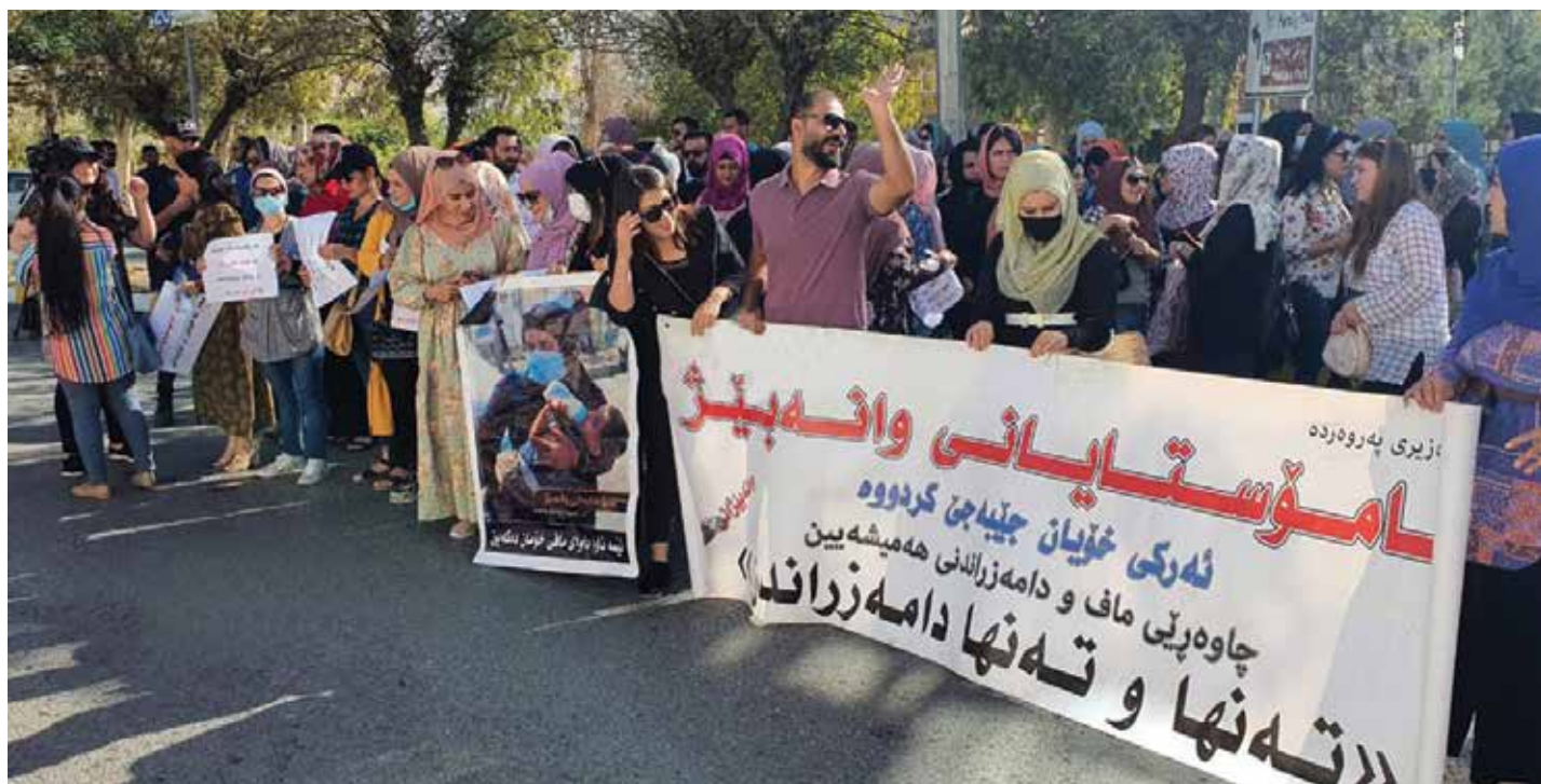
محاضرو السليمانية يختارون مكاناً جديداً للاحتجاج ويهددون بالتصعيد

في المقابل، واصل أهالي قرى ومناطق قضاء سيد دخيل في محافظة ذي قار، مطالباتهم بإيصال مياه الشرب الى قراهم. وتجمع العشرات من أهالي قرى العبودة وال بوزيد وال ابراهيم امام قائممقامية قضاء سيد دخيل، للمطالبة بإيصال المياه الصالحة للشرب، مشيرين الى ان السكان يعتمدون في توفير مياه الشرب على الابار الارتوازية التي وصلت درجة الملوحة فيها الى مستويات قياسية تجعلها غير صالحة للشرب. وتظاهر العشرات من خريجي المعاهد التقنية وكليات القانون في المحافظة، للمطالبة بتوفير فرص العمل. وقال مراسل «طريق الشعب»، ان «العشرات من الخريجين من مختلف الاختصاصات، نظموا تظاهرة امام ديوان المحافظة للمطالبة بتوفير فرص العمل». الى ذلك، تظاهر العشرات من أهالي قضاء القرنة في محافظة البصرة احتجاجا على تعاقب الشركة التركية المشرفة على تنفيذ مشاريع البنى التحتية في القضاء، مع شركة غير رصينة على إنجاز مشاريع خدمية، وبالتالي تحولت شوارع القضاء الى ركام، بحسب مواطنين.