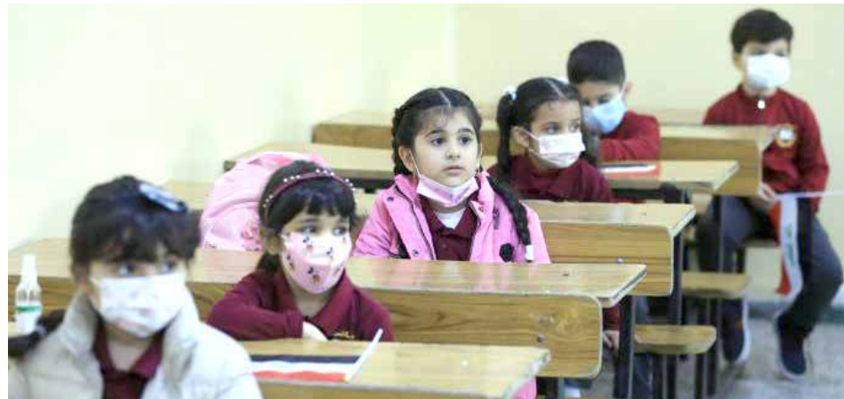
الاعلان عن عودة الدوام الحضوري.. الترتيبات غير مكتملة

الالكتروني لأنهم متخوفون من الوباء وكانوا حريصين بنفس الوقت على مستوى أبنائهم وبناتهم العلمي". ويقول الخرزجي: "عملت قدر المستطاع على دفع أولادي للتعلم على المنصة الالكترونية، لكن مستواهم لم يكن مثملاً في الدوام الحضوري والسبب عدم تقبلهم الفكرة بسهولة. الأمر الآخر المهم هو أن المدارس غير مهيأة لمثل هذا النوع من التدريس والبنية التحتية متساهلة، ما جعل التعليم خلال السنتين الماضيتين أمراً مأساوياً".