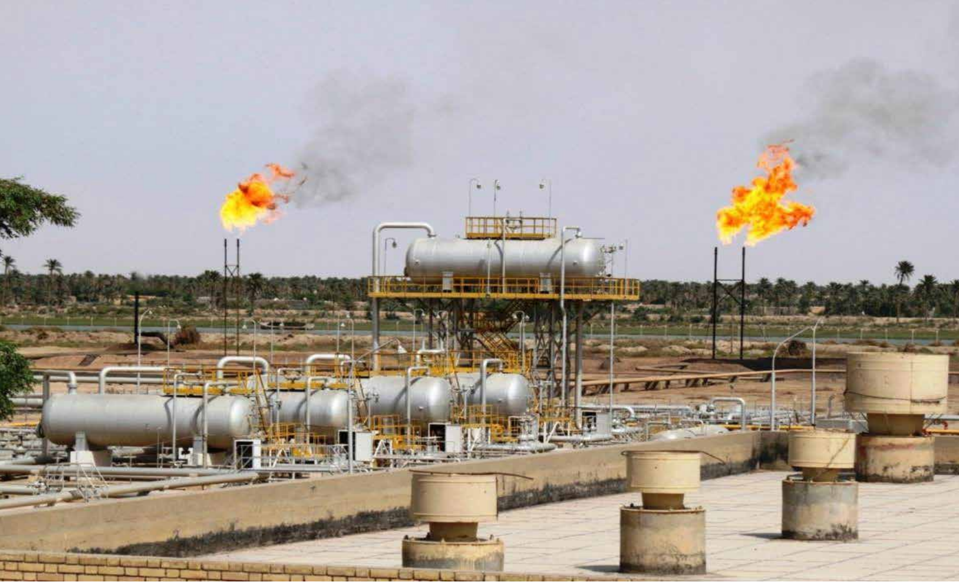
العراق يحرق غازه ثم يستورد الغاز الذي يحتاجه من الخارج وسكانه بلا كهرباء