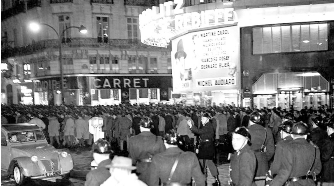
متظاهرون جزائريون في باريس