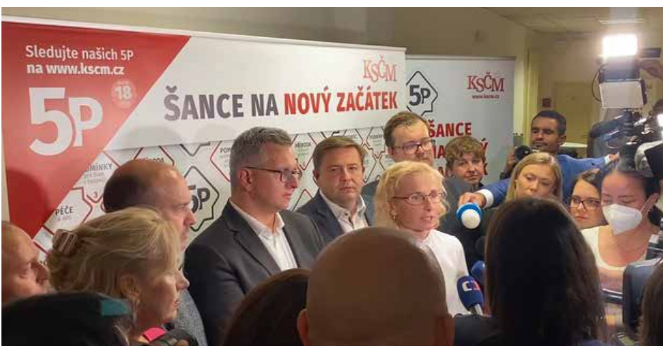
كاترينا كونينا، أثناء المؤتمر الصحفي للحزب الشيوعي التشيكي

التحالف اليساري العريض، ولكن يبقى السؤال ما هي الآليات التي يمكن اعتمادها في المستقبل؟ إن التعامل مع الهزيمة الانتخابية أكثر صعوبة، من الظروف التي سبقتها. وبسبب الأغلبية الليبرالية المحافظة، التي ستحدد مسار السياسة التشيكية في المستقبل، سيتم تهميش القضايا التي يتبناها اليسار.