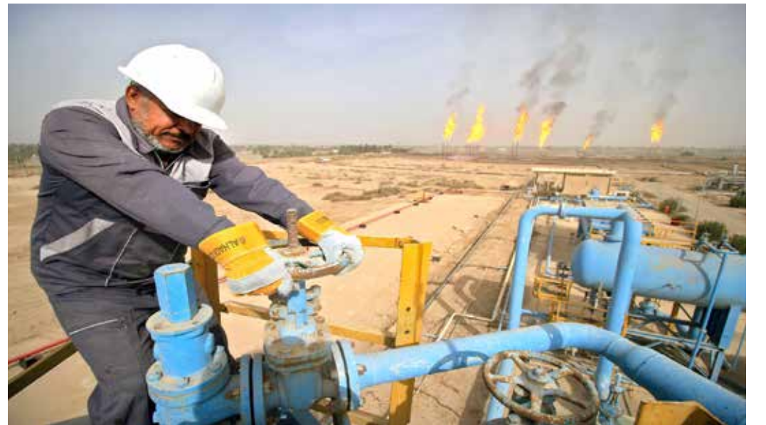
عائدات النفط مورد اساسي للموازنة

كما يشير الى وجود كثير من الإشكاليات المالية التي قد تؤثر إقرار الموازنة عدة أشهر بعد استئناف عمل البرلمان الجديد، وفي مقدمتها سعر بيع النفط في الموازنة، وكذلك سعر صرف الدولار الذي رفعته حكومة تصريف الأعمال الحالية من 1200 دينار للدولار الواحد في موازنة العام الحالي إلى 1450، ما تسبب باعتراضات سياسية وشعبية واسعة.