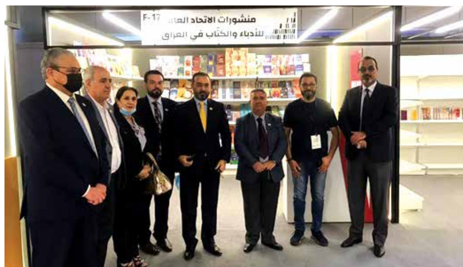
مجموعة من الأدباء أمام جناح منشورات اتحاد أدباء العراق

أتم الاتحاد العام للأدباء والكتاب في العراق، بواسطة منشوراته، مشاركته في معرض الرياض الدولي للكتاب، الذي أقيم في الفترة من 1 إلى 10 تشرين الأول الجاري في العاصمة السعودية الرياض، بمشاركة نحو ألف دار نشر ومكتبة. وجاءت مشاركة الاتحاد في هذا المعرض "المهم"، إيماناً منه بـ "ضرورة إيصال نتاج أعضائه إلى القارئ العربي والعالمي، وتعميم المعرفة" - بحسب بيان صادر عن المكتب الإعلامي للاتحاد. واستطاع الاتحاد إيصال 200 عنوان من إصداراته، إلى المعرض. وقد لاقى الجناح المخصص لمنشوراته،