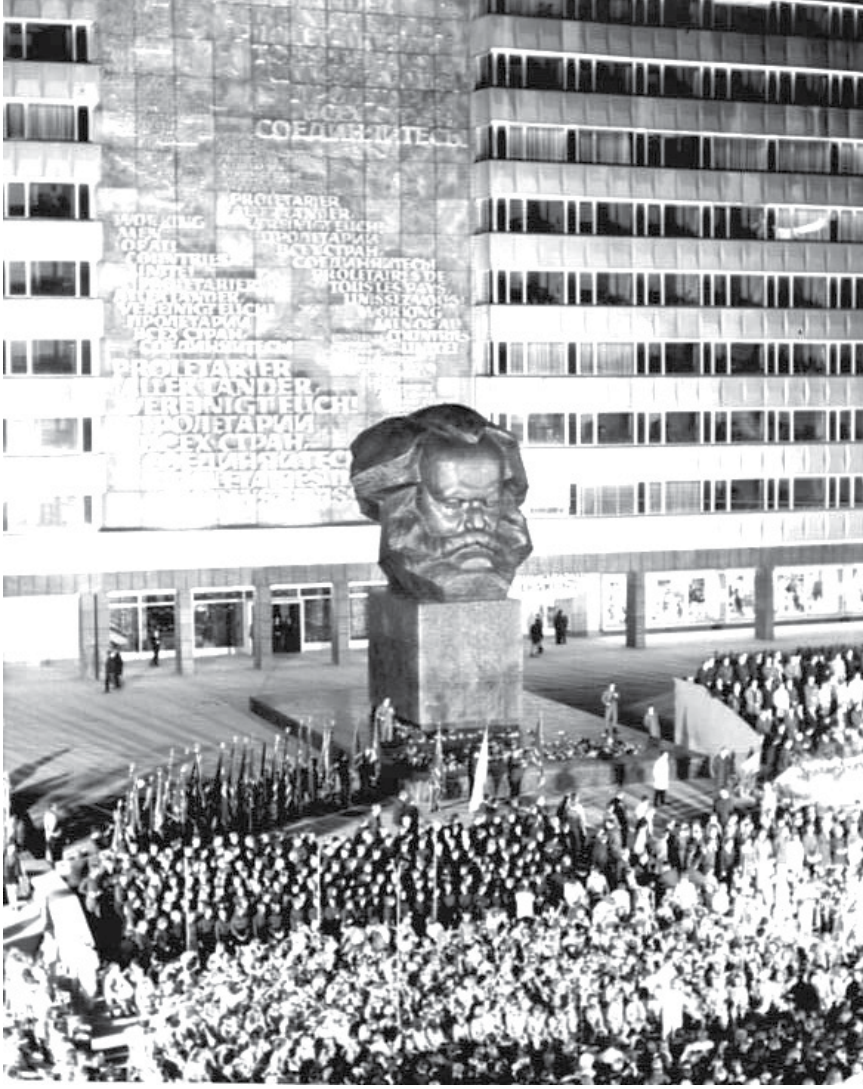
ازاحة الستار عن «رأس» ماركس عام 1971

احتفل أهالي مدينة كيمنتز الألمانية (كان اسمها كارل ماركس شتاد، أي مدينة كارل ماركس)، السبت الماضي، التاسع من تشرين الأول الحالي، بالذكرى الخمسين لازاحة الستار عن نصب «رأس» كارل ماركس. وهذا النصب الضخم، الذي أبدعه النحات السوفييتي ليف كيريل، هو رأس بطول 7 أمتار، ويبلغ مع المنصة ارتفاعا يزيد على 13 مترا ويوزن حوالي 40 طنا. وعلى جدار خلف النصب مباشرة، نقش شعار «يا عمال العالم اتحدوا!» بأربع لغات هي الألمانية والإنجليزية والفرنسية والروسية. وهو النصب الأكثر شهرة في مدينة كيمنتز، وثاني أكبر تمثال نصفي في العالم، بعد «رأس» لينين الذي يبلغ ارتفاعه 14 مترا في مدينة أولان أودي بروسيا.