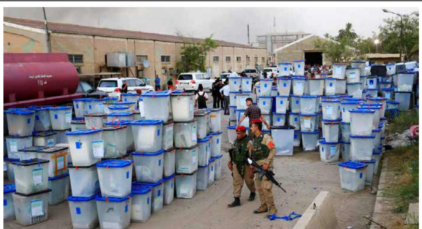
مفوضية الانتخابات تبدأ الفرز والعد اليدوي لصناديق الاقتراع في المحطات المحجوزة أمس

ورصدت المنظمات عملية الاقتراع منذ افتتاح المراكز الانتخابية حتى اغلاقها. وأكدت أنها غطت تلك العملية في أغلب المحطات الانتخابية في عموم البلاد. وفي تقرير أولي لتحالف الشبكات والمنظمات الوطنية المراقبة للانتخابات مجلس النواب، جرى رصد 3847 حادثاً، من قبل أكثر من 10 الاف و500 مراقب في عموم المحافظات. << 2