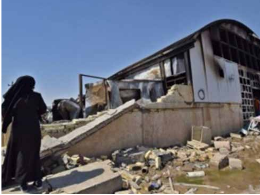
من آثار حريق "مستشفى الحسين" في الناصرية

وكان المتحدث باسم وزارة الصحة، د. سيف البدر، قد كشف في تصريحات صحفية سابقة، عن هجرة أكثر من 20 ألف طبيب عراقي منذ عام 2003، بينهم أصحاب كفاءات نادرة.