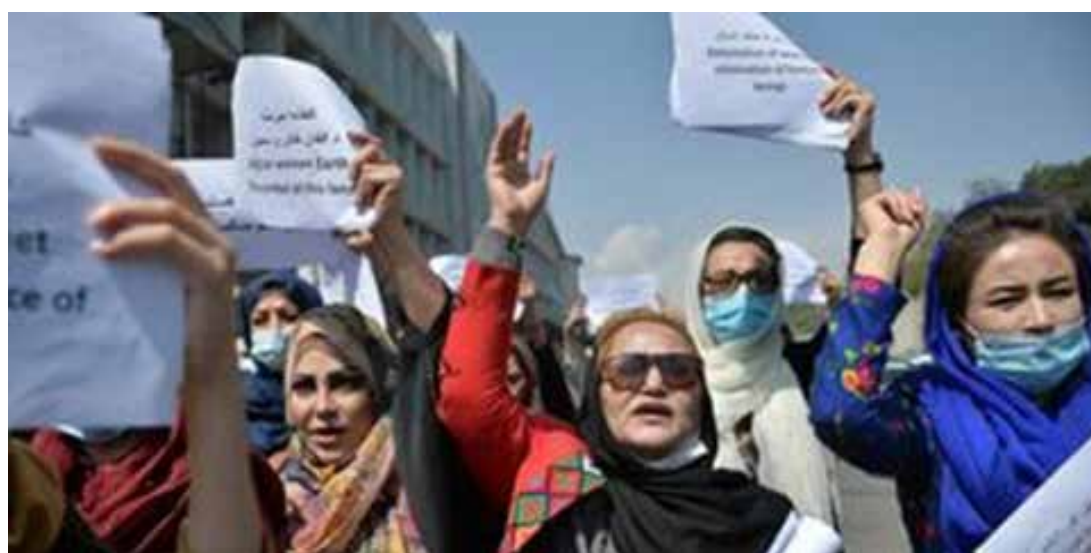
احتجاج نسوي ضد حكومة طالبان