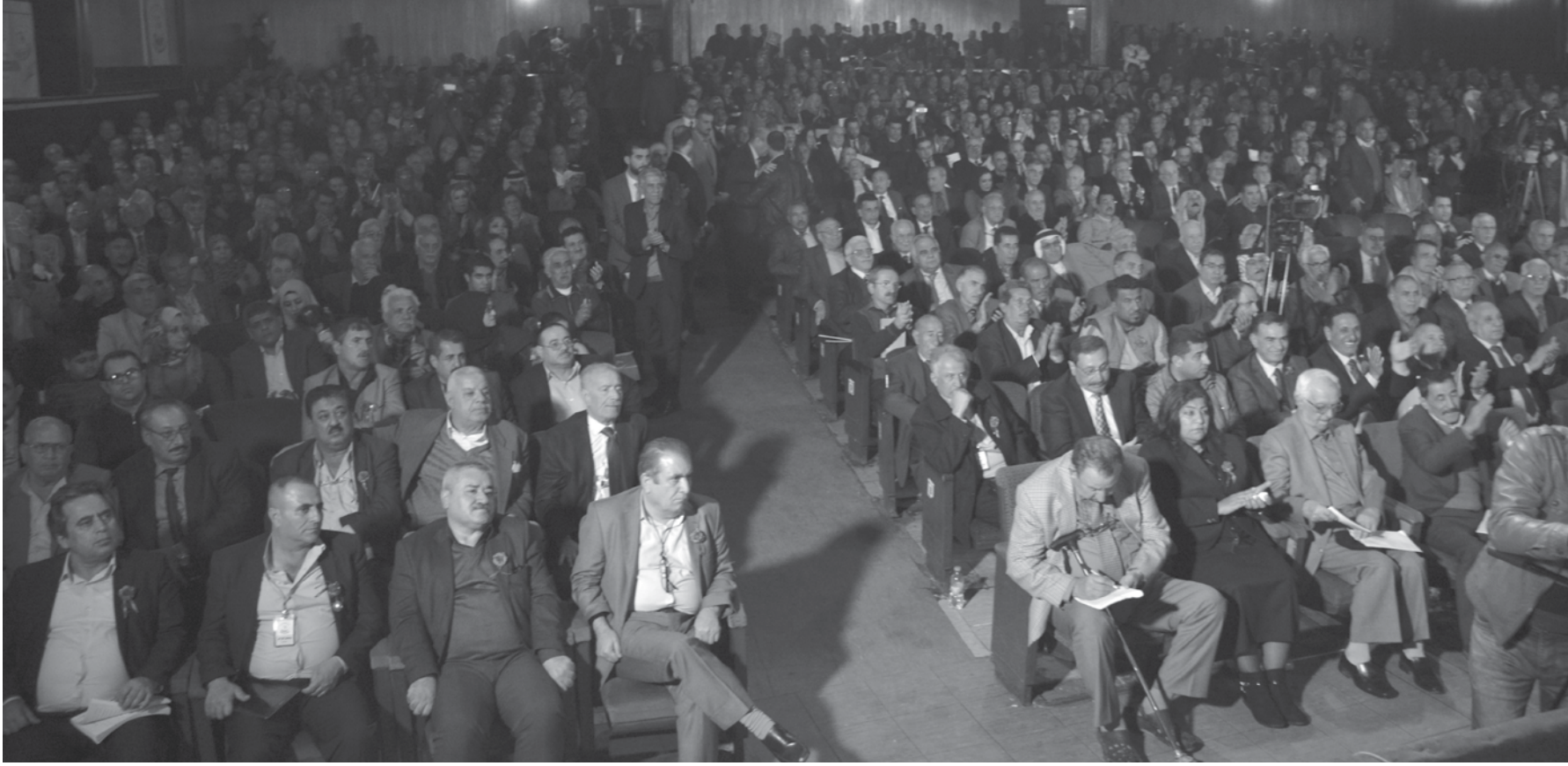
جانب من افتتاح المؤتمر الوطني العاشر