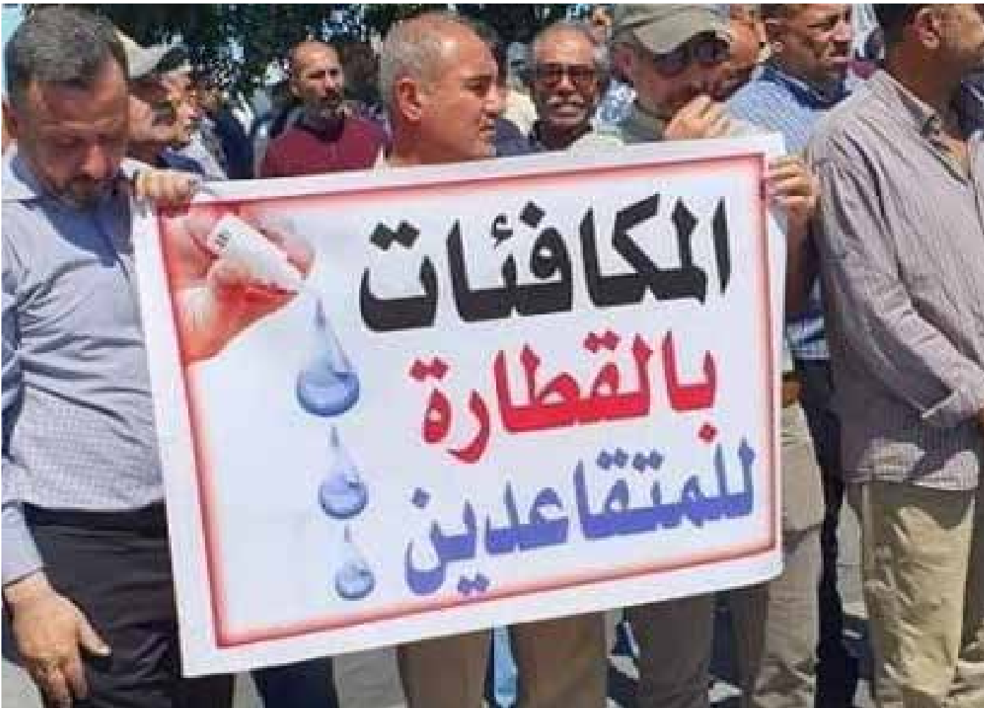
تظاهرة المتقاعدين امس في بغداد

وطالب ذوو الضحايا، مؤسسة الشهداء بالإسراع في إنجاز معاملاتهم من اجل تخفيف العبء عن العوائل المنكوبة. وتظاهر عدد من اصحاب المخازن والافران في المدينة امام مبنى ادارة المحافظة، احتجاجاً على ارتفاع اسعار مادة الطحين، مطالبين الجهات الحكومية بالتدخل لمعالجة ارتفاع اسعار الطحين، الذي وصل سعر الكيس زنة 50 كيلو غراماً الى 30 ألف دينار.