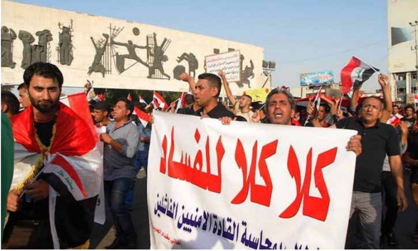
مئات اللجان التحقيقية لا أحد يعرف نتائجها

تقف العملية السياسية التي تواجه مصاعب ومعرقات لا حصر لها، أمام اتهامات كثيرة تتعلق بالتغطية على ملفات فساد وهدر وخراب اقتصادي وأمني كبير. وتوجه معظم الاتهامات صوب لجان التحقيق التي يجري تشكيلها للبحث والاستقصاء بعد كل جريمة أو أزمة تحدث؛ حيث يعتقد ناشطون ومختصون أنها دائماً ما تخضع للضغوط السياسية. ولهذا فإن الرأي السائد هو عدم فاعلية هذه اللجان، حتى وإن قدمت نتائج هنا وهناك.