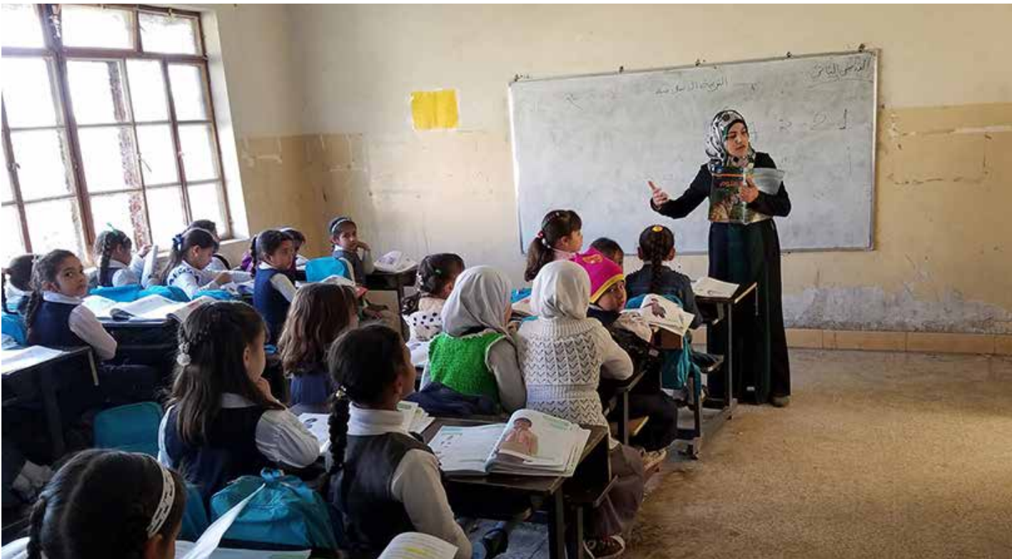
مدارس مكتضة بالتلاميذ.. وبنى تحتية متهاكلة

وأشار إلى "افتتاح مراكز لقاح داخل الجامعات من أجل توفير بيئة صحية منسجمة متكاملة، وبالتالي الذهاب إلى الدوام الحضورى"، موضحاً أن رئيس الوزراء مصطفى