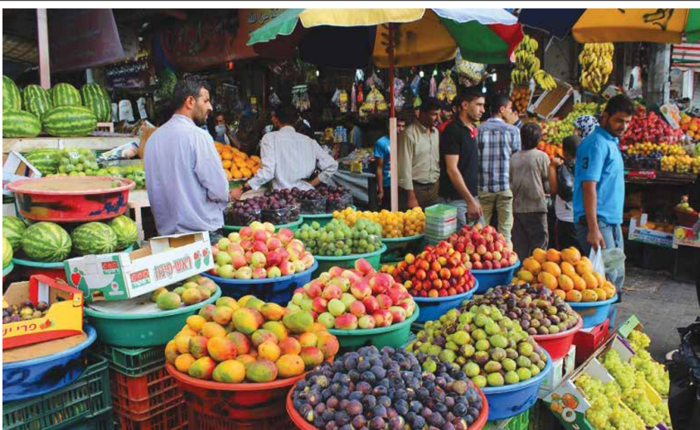
ارتفاع أسعار المواد الغذائية.. تحدّي جديد امام العراقيين