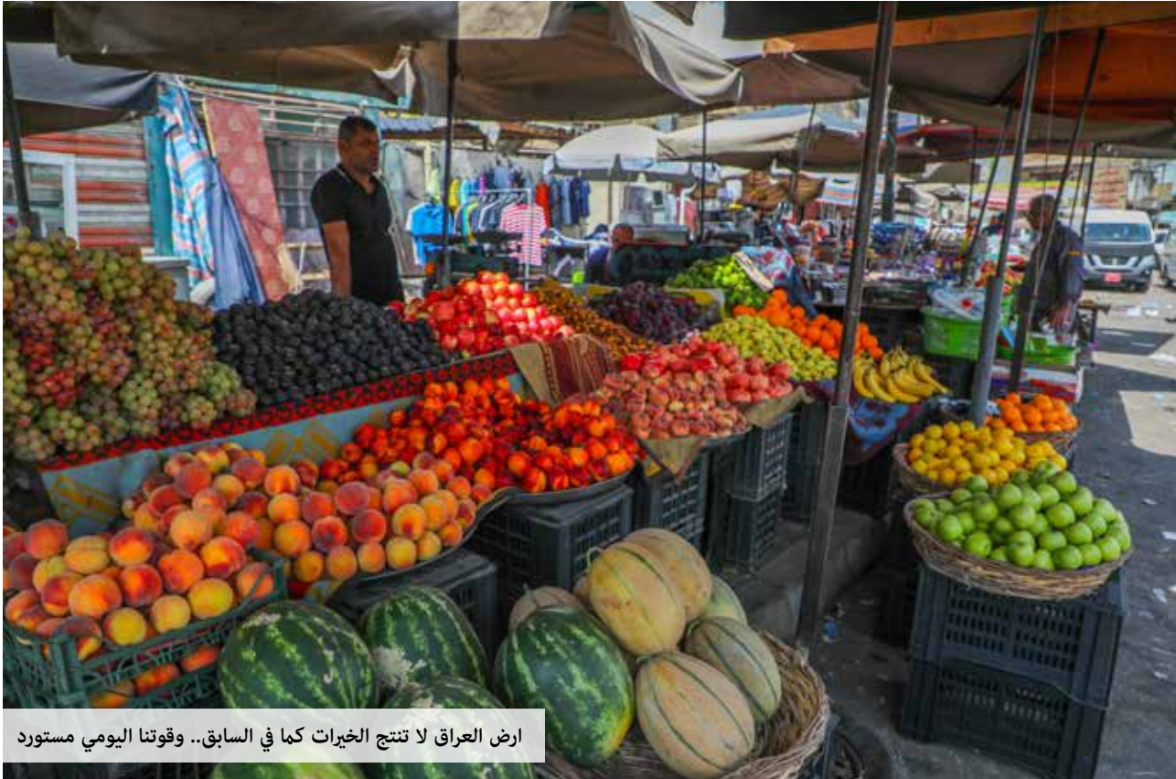
ارض العراق لا تنتج الخبرات كما في السابق... وقوتنا اليومي مستورد

مضاعفا على الفقراء بعد ارتفاع الاسعار عالمياً، بحسب قوله. وخلص الى ان "عملية تغيير سعر الصرف وتخفيضه ليست سهلة، وقد حاولت الحكومة مكافحة الاحتكار لكنها لم تنجح".