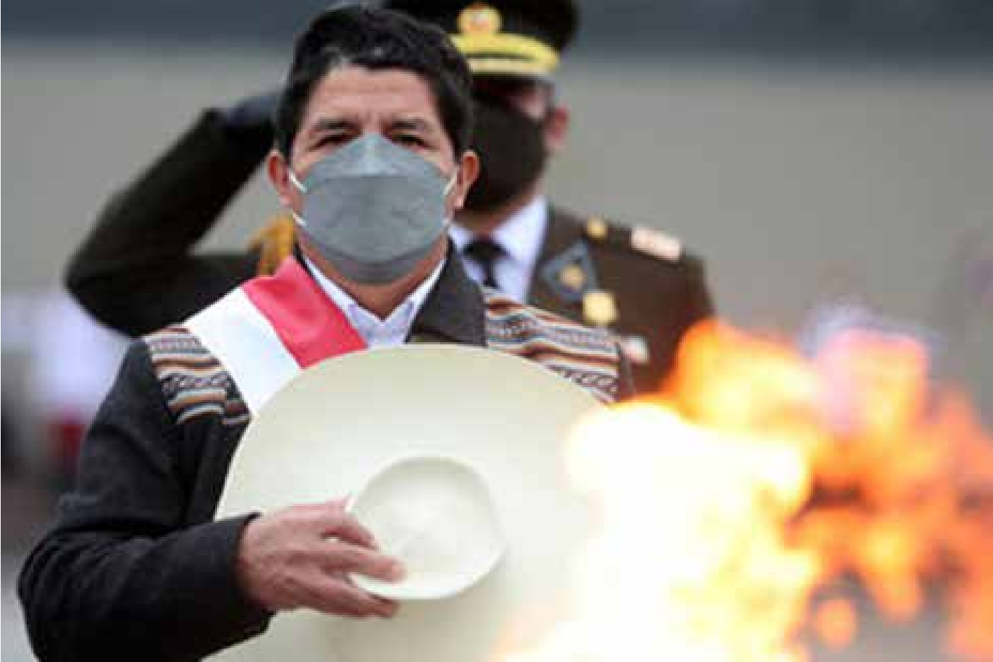
نرفض التدخل في الشؤون الداخلية للبلدان الأخرى - الرئيس كاستيلو في 30 تموز