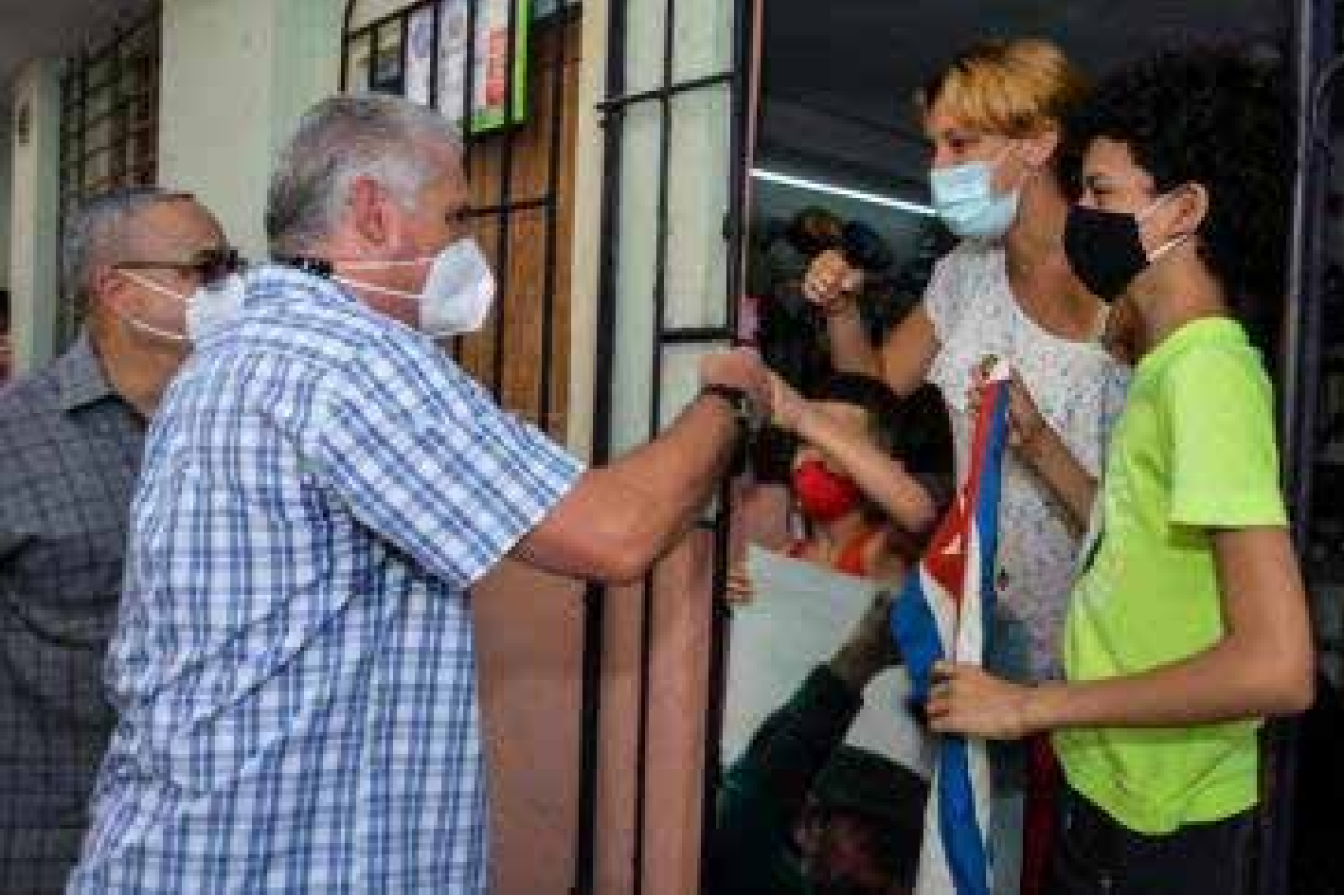
الرئيس الكوبي دياز كانيل اثناء جولة في منطقة هافانا القديمة

تشهد كوبا حملة مكثفة لتبادل الأفكار والتصورات بين أعضاء الحكومة والسكان. وبمشاركة مباشرة من السكرتير الأول للجنة المركزية للحزب الشيوعي الكوبي ورئيس الجمهورية ميغيل دياز كانيل.