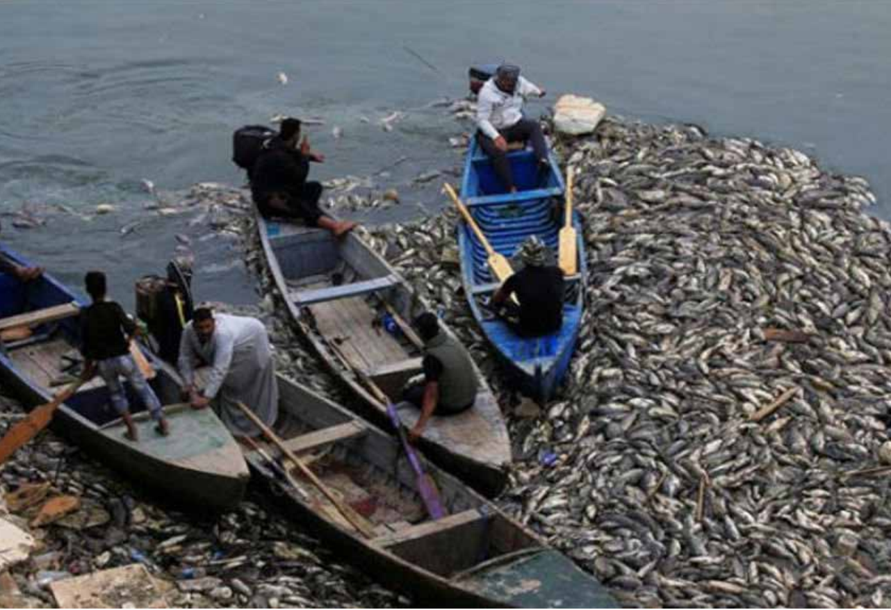
الثروة السمكية تتعرض لعملية إبادة من جهات تحاول ضرب اقتصاد البلد