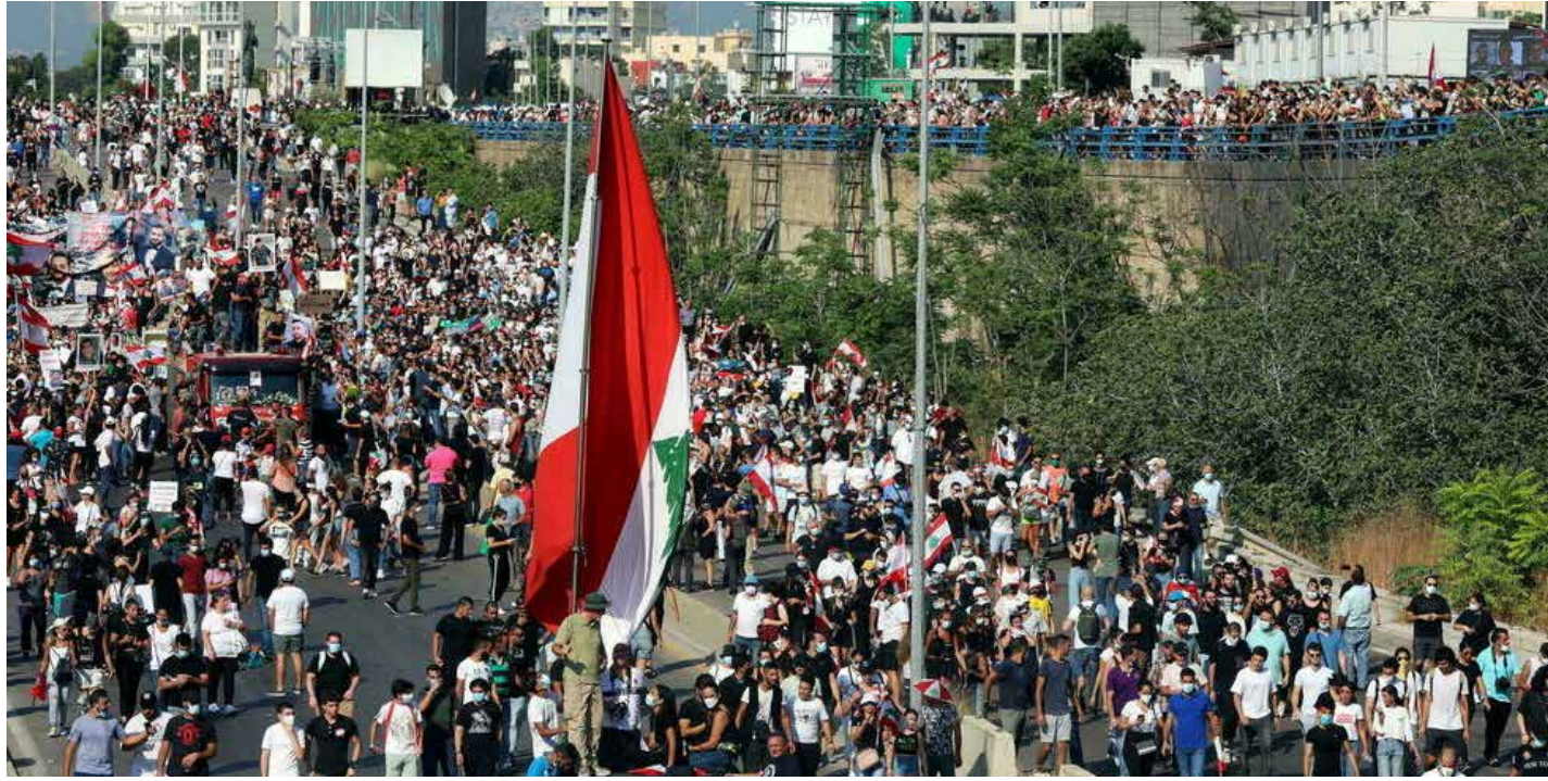
تظاهرات حاشدة في بيروت بعد عام على كارثة انفجار المرفأ

وقالت هيومن رايتس ووتش في التقرير الذي أصدرته قبل يوم واحد من الذكرى السنوية الأولى للانفجار المدمر، إن "المشاكل البنوية في النظامين القانوني والسياسي في لبنان، تسمح للمسؤولين بالإفلات من المساءلة والعقاب، خاصة أنه لم يتهم أي منهم حتى الآن على خلفية الكارثة". وعرض التقرير الذي تابعته "طريق الشعب"، أدلة على