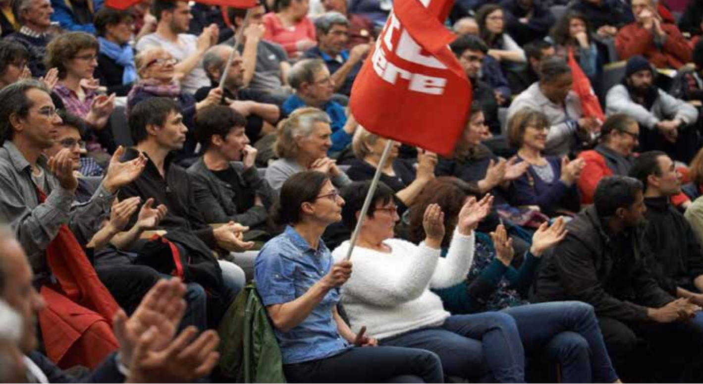
من فعالية سابقة للشيوعي الفرنسي

مع الاشتراكيين والخضر، وكذلك مع حركة "فرنسا الأبية" بزعامة اليساري الشعبي جان اوك ميلينشون، وفي بعض الدوائر بقوائم منفردة للحزب. وحصل الشيوعيون على 62 مقعداً مقابل 29 مقعداً في انتخابات عام 2015. وفي بيان أصدره الحزب في 28 حزيران قيم عاليًا النتائج وعبر عن ارتياحه، لعموم نتائج اليسار والخضر، وأداء الشيوعيين. بالإضافة إلى ذلك استعاد الحزب تمثيله في 17 برلمان محلي. وفي بيانه شدد الحزب، وعلى أساس حساب النواب المحليين على كامل التراب الفرنسي، على أن الحزب لا يزال "القوة السياسية الثالثة في فرنسا". وأشار البيان بفخر إلى مساهمة الشيوعيين في جميع المناطق والإدارات بهزيمة اليمين المتطرف.