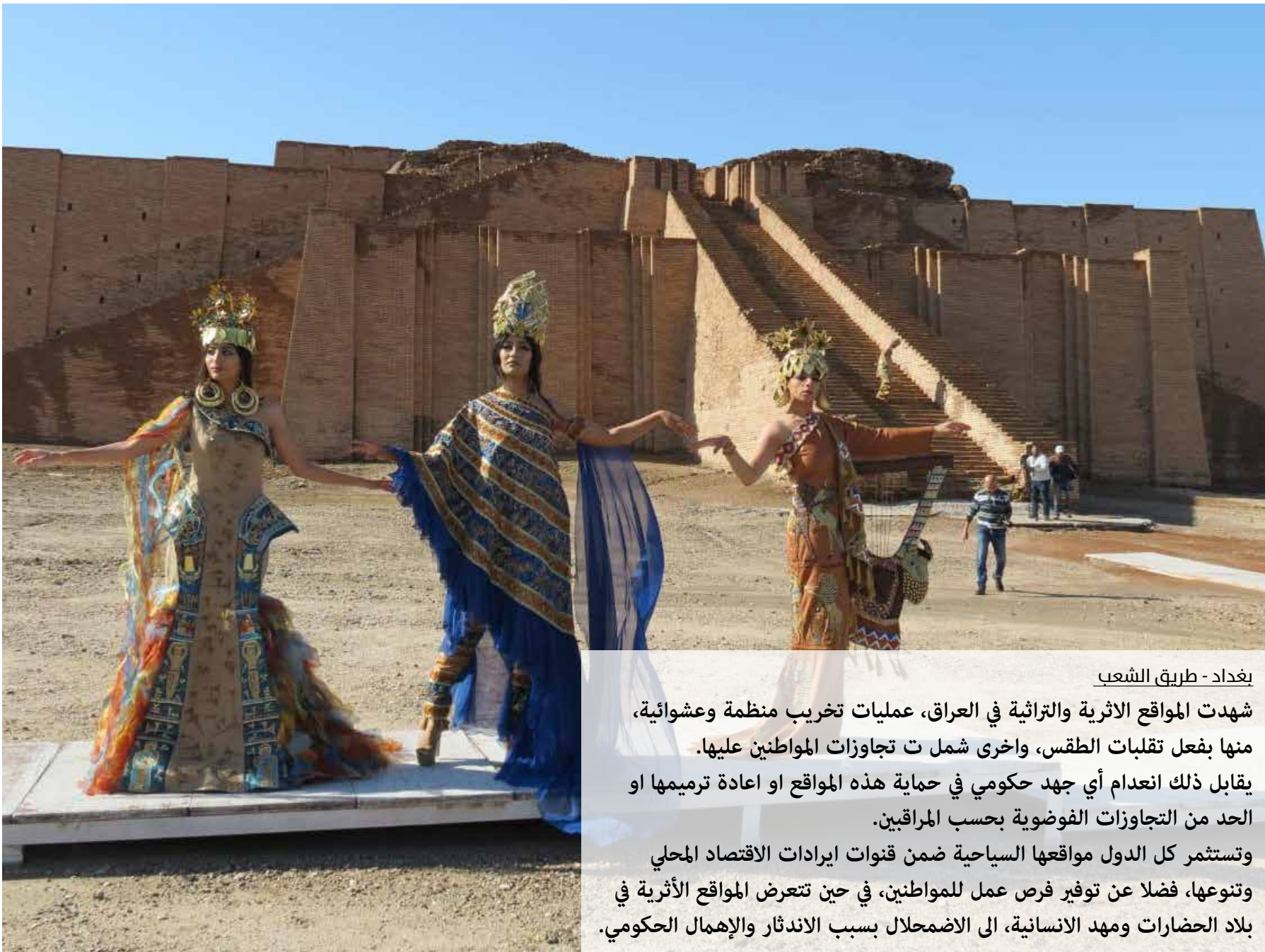
بغداد - طريق الشعب

شهدت المواقع الاثرية والتراثية في العراق، عمليات تخريب منظمة وعشوائية، منها بفعل تقلبات الطقس، واخرى شملت تجاوزات المواطنين عليها. يقابل ذلك انعدام أي جهد حكومي في حماية هذه المواقع او اعادة ترميمها او الحد من التجاوزات الفوضوية بحسب المراقبين.