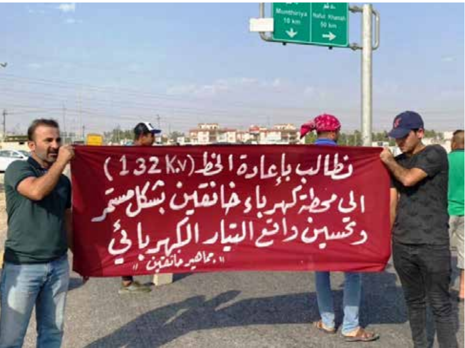
تظاهرة في خانقين

وشهدت محافظة ديالى، تظاهرات احتجاجية غاضبة بسبب تردي واقع الخدمة الكهربائية في المحافظة. وذكرت مفوضية الانتخابات في بيان طالعته ”طريق الشعب“، ان ”فريقا من مكتب المفوضية العليا لحقوق الانسان في محافظة ديالى، رصد تظاهرة احتجاجية لعدد من اهالي قضاء الخالص امام محطة توزيع الكهرباء في