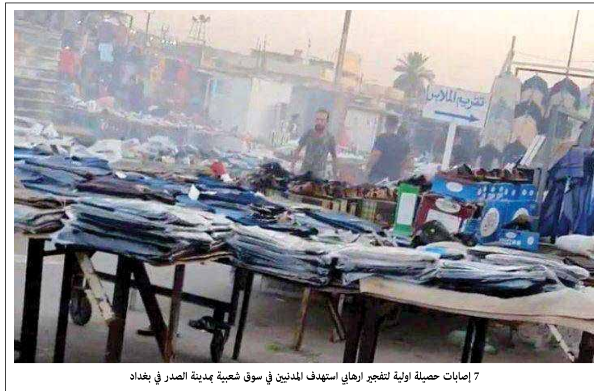
7 إصابات حاصلة اولية لتفجير ارامي استهدف المدنيين في سوق شعبية بمدينة الصدر في بغداد