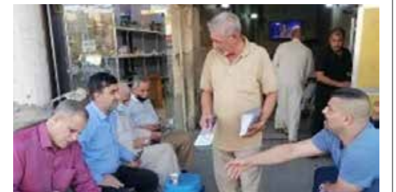
كربلاء - حسن مهدي

شكلت منظمة الحزب الشيوعي العراقي في قضاء الهندية محافظة كربلاء، الجمعة الماضية، فريقا إعلاميا جوالا جاب العديد من شوارع القضاء وأسواقه سيرا على الأقدام. ووزع الفريق على المواطنين وأصحاب المحال التجارية ورؤاد المقاهي، نسخا من كراسر يتضمن حوارا كان قد أجراه المركز الإعلامي للحزب مع سكرتير اللجنة المركزية، الرفيق رائد فهمي، حول التعليق المشروط لمشاركة الحزب في الانتخابات.