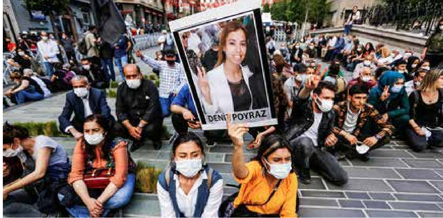
تظاهرة في اسطنبول بعد مقتل دنيز بويراز

وقد أدت حملات القمع والتنكيل إلى ابعاد معظم رؤساء البلديات المنتخبين ديمقراطيا، وزج الكثير منهم في السجن، وابداهم بإدارات معينة. إلى جانب اعتقال العديد من نواب حزب الشعوب الديمقراطي بتهمة الإرهاب الملققة، والحكم على رئيس الحزب المشارك صلاح الدين ديميرتاش، وحجزه، منذ تشرين الثاني 2016، في أحد سجون أدنة شديدة الحراسة. وتتجاهل الحكومة التركية قرار المحكمة الأوروبية لحقوق الإنسان بإطلاق سراح ديميرتاش فوراً.