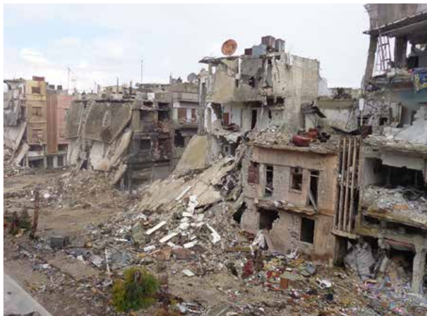
في قضاء القائم في محافظة الأنبار

المواطنون من بناء منازلهم، وترك مخيمات النزوح أو المنازل التي استأجروها في مناطق أخرى.