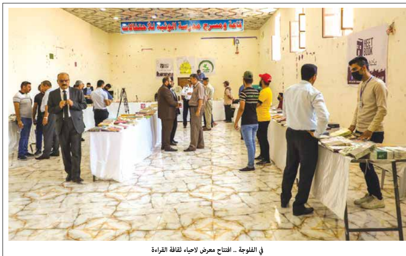
في الفلوجة.. افتتاح معرض لاهياء ثقافة القراءة

واشارت الورقة الى انه برغم إتساع الرفض الشعبي ومساحة القوى ذات المصلحة في التغيير، إلا ان ذلك لم يتحول إلى فعل سياسي مكافئ لحجم التضحيات، بسبب تشتت هذه القوى وعدم تبلور رؤية موحدة. ولأجل تأمين مقدمات وشروط التغيير المنشود، فإن هناك ضرورة ملحة الى ان تتوصل القوى ذات المصلحة والتي تتبنى هذا المشروع في هذه المرحلة الحرجة، الى مختلف أشكال التعاون والتنسيق من أجل توحيد المواقف وسبل العمل السياسي الوطني المشترك، وإعتماد مختلف أشكال النضال السياسي.