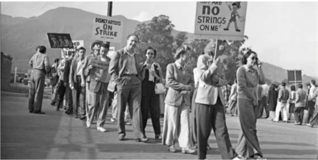
ميكي ماوس وإضراب العمال

رسامو الكاريكاتير التضامن مع النقابات الأخرى. مع استمرار الإضراب، اعتبرت ديزني الإضراب كاعتداء شخصي، وعلى الرغم من وجود عدد قليل جداً من اليساريين في نقابة رسامي أفلام الكرتون، فقد نشرت ديزني رسالة تدعي فيها أن «التحريض الشيوعي والقيادة والأندية الشيوعية هي التي أدت إلى هذا الإضراب». نتج عن الإضراب مفاوضات واشتراطات التي أعادت العمال المفصولين قبل الإضراب مع منع فصلهم بشكل دائم، وجرت معادلة الأجور ونظام دفع الرواتب ونظام التصنيفات وإجراءات التظلم.