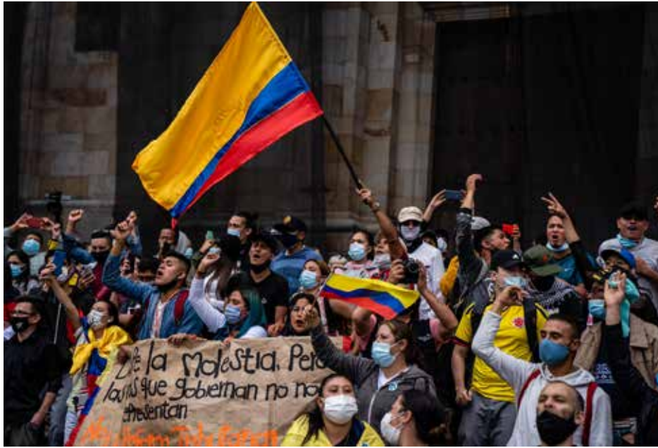
احتجاجات 2021 في كولومبيا

تعود البدايات الأولى إلى تشرين الثاني 2019، حينها، دعت النقابات والحركات الاجتماعية ومنظمات السكان الأصليين والسود إلى الإضراب، وبمشاركة طلابية.. في ليلة الحادي والعشرين من تشرين الثاني، خلقت الحكومة أجواءً من الخوف، ونشرت شائعات عن جماعات مسلحة يقودها أجنب، تحاول اقتحام المنازل ونهبها، مبررة بذلك قمع أجهزتها الأمنية للسكان. لقد كانت احتجاجات 21 تشرين الثاني 2019 أكبر احتجاجات تشهدها البلاد. وحاول الرئيس السابق