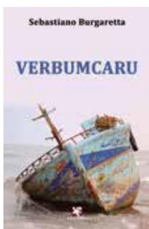
غلاف كتاب بورغاريتا

** نعبر ملعون زمن العبور ونحن الصغار نتجه صوب الموت واحد تلو الآخر. متباعدين ... قابعين في قعر القارب، وبكل تجرد من روح، رموا أولى الجثث لتوفير باحات .. للباقين .. أحياناً ** وفي موضع آخر من الملحمة الشعرية لكتاب بورغاريتا جاء: يومها ... بعد المأساة فهو عمدتنا المتنور حمل تلك اللحظات ... وكم كان ثقيلاً ... ليتذكر من جديد، حينها: أن روما مدينة مفتوحة. وأن راية الصومال تنتصر، وسقطت أشعة وجدان مرفوعة. وبينهما، همز حجاب المعبد تعرى ... وصار كل شيء مرثياً كل شيء صار مرثياً ... كنور. شرف ضاع، تنبأ لهذا الحال إذ تعالج بالرحمة الشفقة. غداً السير أماماً ... مع تلك الموسيقى الجنائزية. وقفروا قناني العصور ... **