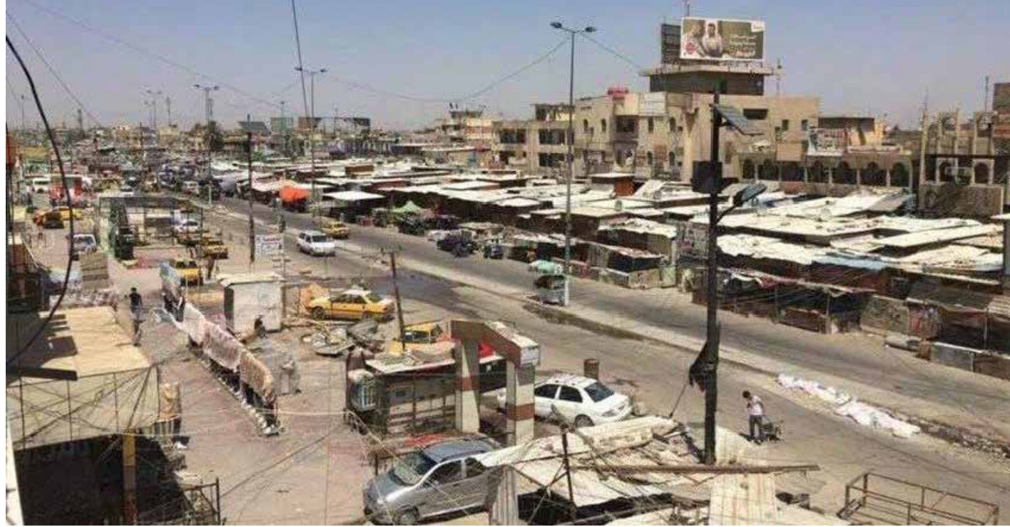
وعود حكومية مستمرة بتخفيف أزمة السكن في مدينة الصدر