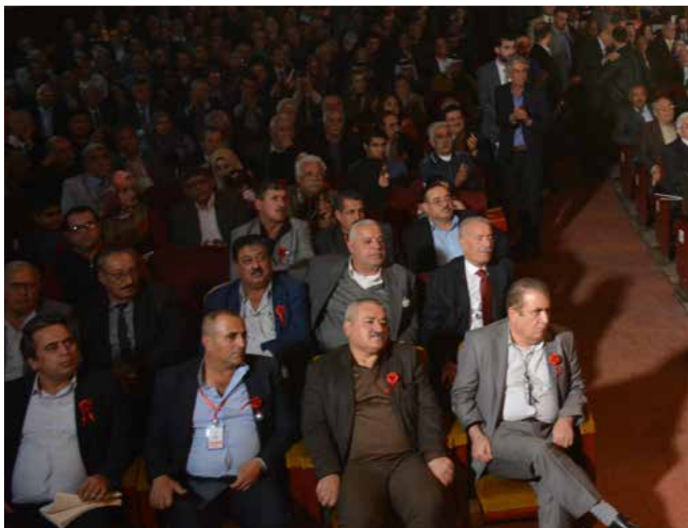
جانب من افتتاح المؤتمر الوطني العاشر

لقد بدأت الديمقراطية، ومنذ المؤتمر الخامس، مؤتمر الديمقراطية والتجديد، بالإتساع والتجذر على حساب المركزية. ولكننا مازنا بحاجة إلى افتتاح أكبر على الرأي