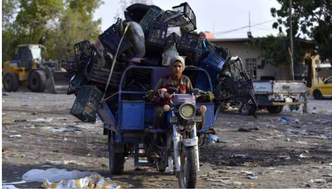
بؤس احوال البلدان التي اعتمدت وصفات المؤسسات المالية الدولية

وأضاف عباس ان "وزير المالية اليوناني السابق وصف العملية بخصخصة للأرباح وتأميم للخسائر، حيث استفادت المصارف من الأرباح في زمن الازدهار بينما فرضت ضرورة إنقاذها على الشعب ليتمتع ويدفع ثمن خسائرها من خلال سياسات التشفوية المهلكة عند الانهيار". وحذر عباس من "الاستمرار في تطبيق الورقة البيضاء التي حملت المواطن الفقير، مسؤولية سوء الإدارة والفساد للطبقة السياسية الحاكمة"، داعياً الى "ضرورة تشجيع الصناعات الصغيرة والمتوسطة ودعمها بقروض ميسرة لتمكينها من المنافسة في الأسواق ومنع الاستيراد وإعادة سعر صرف الدينار امام الدولار الى سابق عهده".