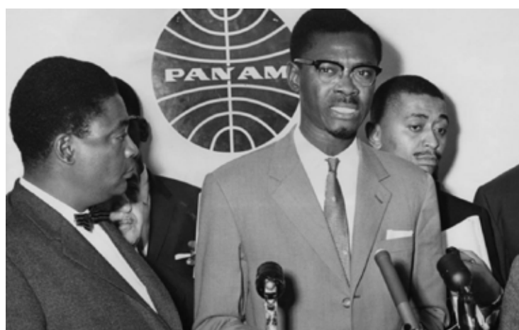
باتريس لومومبا بطل النضال ضد الاستعمار

قبل محاكمة ممكنة في محكمة الجنائيات. وأضاف أن «بلجيكا تواجه شيئاً فشيئاً ماضيها الاستعماري المؤلم والإجرامي وتتخذ إجراءات».