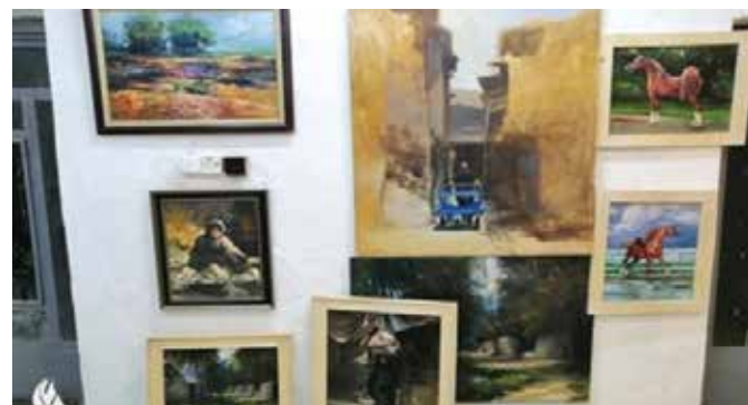
المقر زين بلوحات عدد من فنانا المحافظة