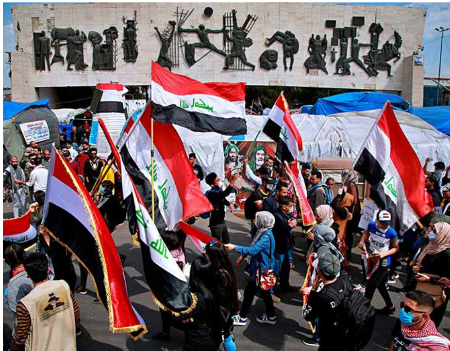
شباب انتفاضة تشرين مستمرين حتى تحقيق المطالب