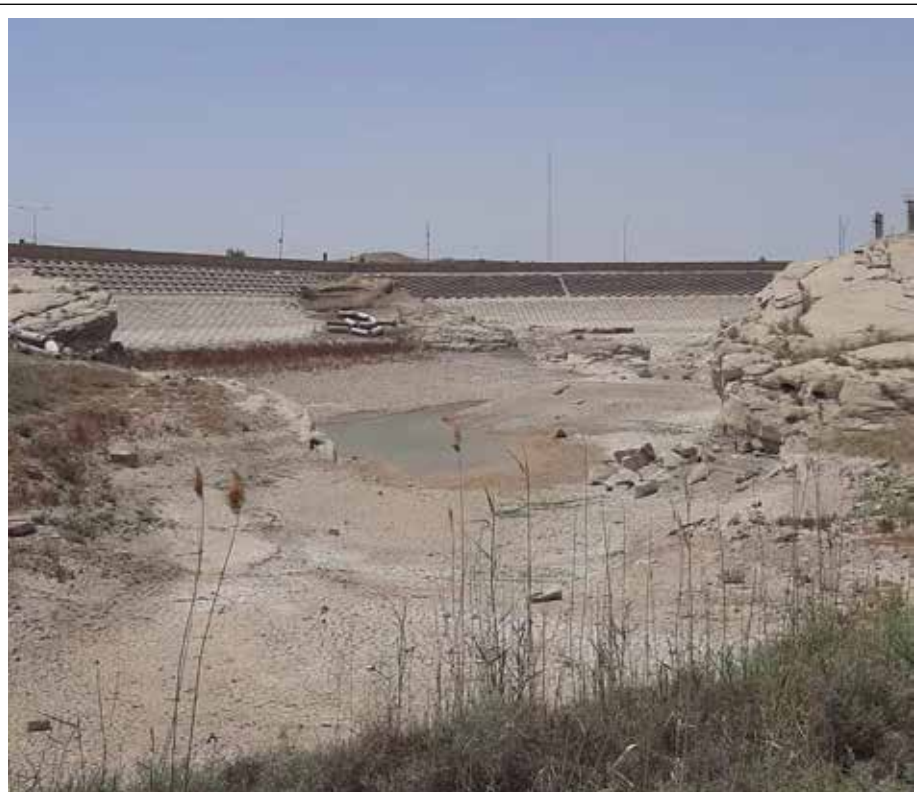
بحيرة حميرين تشكو العطش ولا معلومات عن أية مفاوضات مع الجانب الابراي