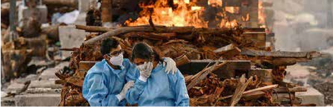
الهند أكثر البلدان تضررا من الوباء

في منظمة الصحة العالمية. ومن مهامها الرئيسية وضع التوجهات، وتقديم المشورة وتنسيق الطلبات، ومراقبة السياسة المالية لمنظمة الصحة العالمية، ومراجعة موازنة البرامج والموافقة عليها. وتنتخب المدير العام لمنظمة الصحة العالمية كل خمس سنوات. تشارك وفود من جميع الدول الأعضاء في منظمة الصحة العالمية البالغ عددها 194 دولة في جمعية الصحة العالمية (الدورة السنوية) وتناقش سنوياً جدول أعمال الصحة الذي سبق أن وضعه المجلس التنفيذي لمنظمة الصحة العالمية. ويجري التفاوض الأولي بشأن القرارات التي ستقر في المجلس التنفيذي لمنظمة الصحة العالمية. تتكون الهيئة من 34 ممثلاً حكومياً فنياً من الدول الأعضاء، وينتخب أعضاء الهيئة بشكل فردي لمدة ثلاث سنوات. وعادة ما يجتمع المجلس التنفيذي مرتين في السنة لتسهيل عمل الدورة السنوية.