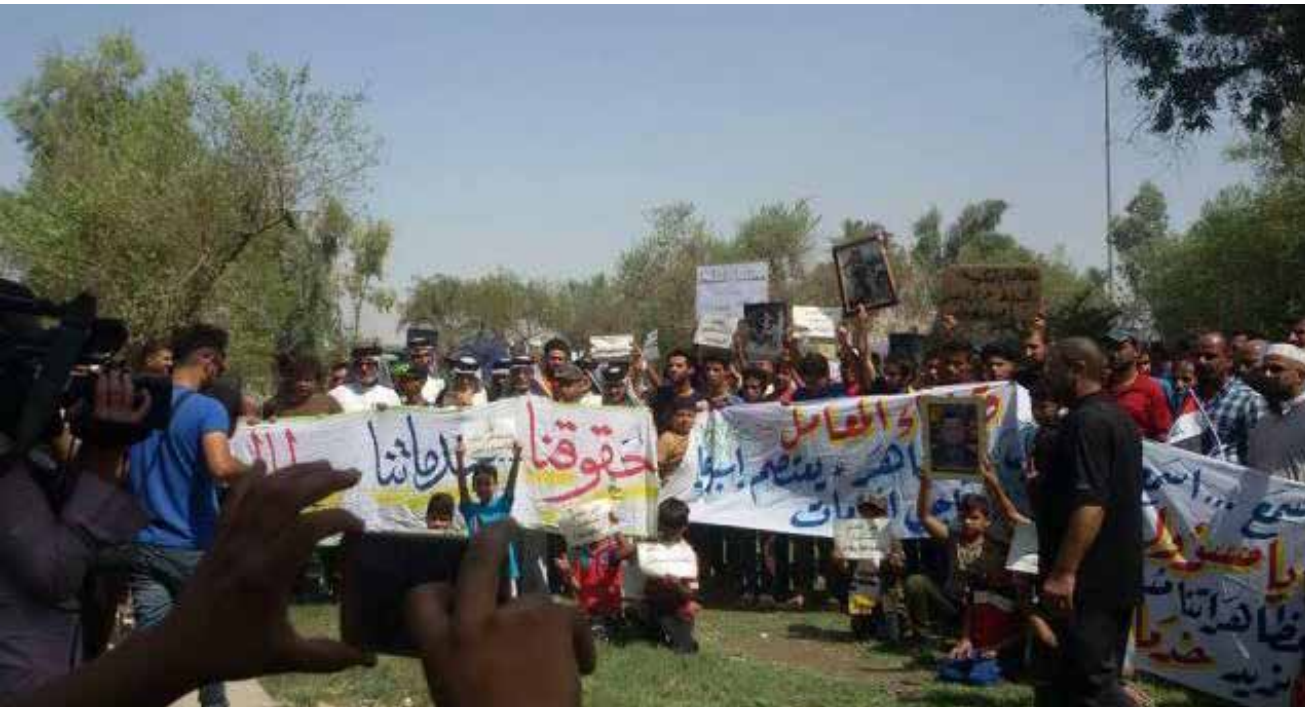
تظاهرة سابقة لاهالي حي النصر تطالب بالخدمات

والخدمية". وزاد أن استمرار التهميش يؤدي الى انفجار غضب شعبي، واندلاع تظاهرات عارمة، تشارك فيها كافة مكونات المحافظة".