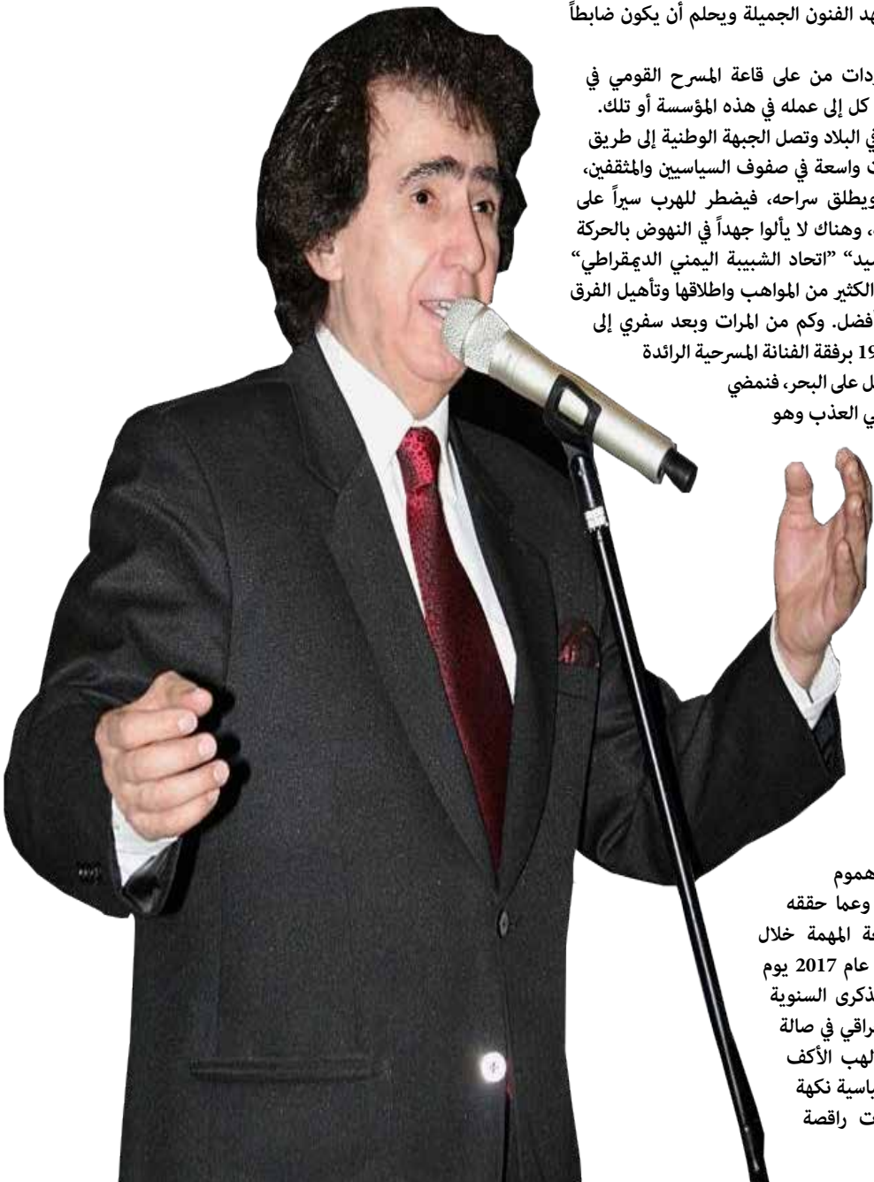
غنى للبصرة وبغداد.. كورونا يخطف رائد الأغنية السياسية جعفر حسن

بعد أن أكمل الراحل شاطي عودة حكوميته، كان ضمن أعداد الألاف من المفصولين السياسيين الذين لم تتم إعادتهم لوطائفهم حتى بعد انتهاء حكومياتهم، عمل مع بعض المقاومين في مشاريع ناجحة، ولعل أبرز تلك المشاريع الأشراف على الجهد الهندسي لبناء جسر الديوانية الحديث، ومن خلال مركزه الهندسي عمل على إحقاق العديد من المفصولين السياسيين بالعمل في الجسر، وكنت واحدا منهم، وجسد لنا شاطي عودة مثالا متميزا من أمثلة التقاني