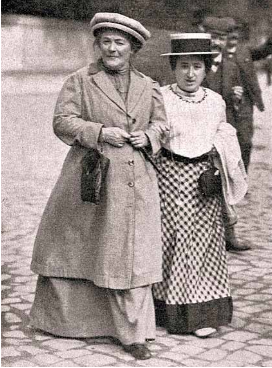
روزا لوكسمبورغ (الى اليمين) وكلارا زيتكين 1910

دار (فيسو) بلندن، ويضم 190 رسالة كتبها روزا لوكسمبورغ إلى شخصيات بارزة في الحركة العمالية والاشتراكية الأوروبية، وهم: ليو جوغيشيز، كارل كاوتسكي، كلارا زيتكين، وكارل لينبخت، وكانوا من بين أقرب رفاقها وأصدقائها. وهذه الرسائل تضيء الحياة الداخلية لهذه الإيقونة، التي كانت قائدة ثورية، ومنظرة اجتماعية واقتصادية، وناشطة سياسية، وكاتبة ذات أسلوب جذاب. (1) إشارة إلى جوليان بوشاردت، الصحفي والناشط اليساري الألماني. (2) في تشرين الثاني عام 1918 جرى تبني اسم «الشيوعيين الأميين» أولاً من جانب المجموعات اليسارية في هامبورغ وبريمن، ثم من قبل مجموعة