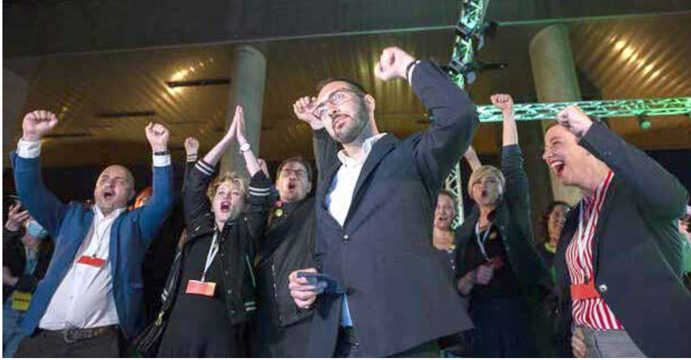
مرشح اليسار لمنصب عمدة العاصمة يتوسط رفاقه بعد الإعلان الأولي للنتائج

وفاز تحالف اليسار، الذي يتبنى سياسة مختلفة، خالية من الفساد والمحسوبية، بأغلبية واضحة في مجلس مدينة زغرب، حاصلا على قرابة 41 في المائة، ولا يحتاج