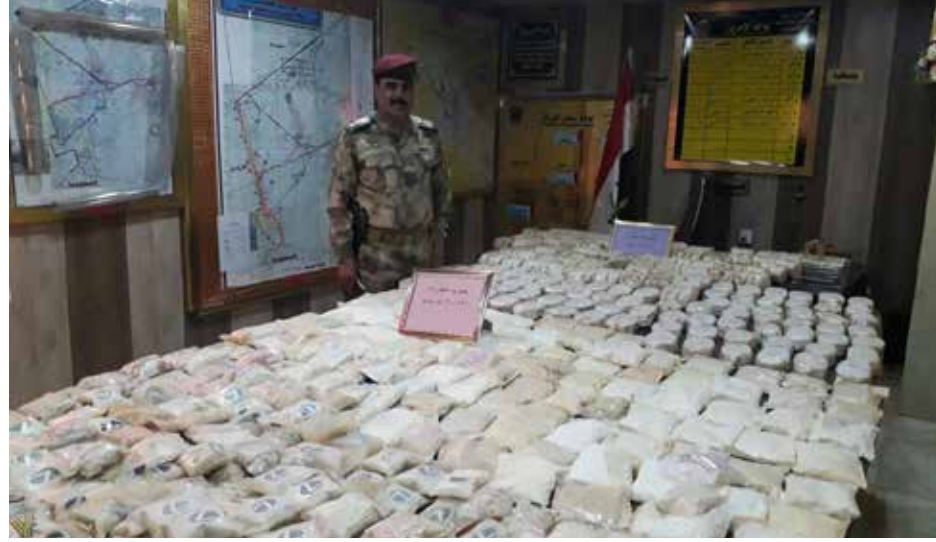
رواج تجارة المخدرات رغم التشديدات الامنية

اتسعت ظاهرة تعاطي المخدرات والمتاجرة فيها، خلال السنوات الماضية، لأسباب يعزوها قضاة ومتخصصون الى «تفشي البطالة والفقر والفساد في اغلب مفاصل الدولة»، داعين الى اتخاذ اجراءات عملية تسهم في محاربة هذه الظاهرة، وتنظيف القوات الامنية واجهزة الدولة ذات العلاقة من الفاسدين، من اجل تمكينهم من مواجهة هذا الوباء الخطر.