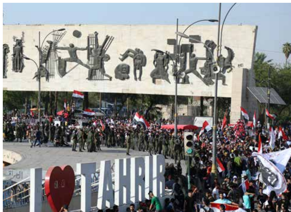
جموع المحتجين في ساحة التحرير

فيما طالبت المفوضية العليا لحقوق الانسان، القائد العام للقوات المسلحة، بتحمل المسؤولية واتخاذ