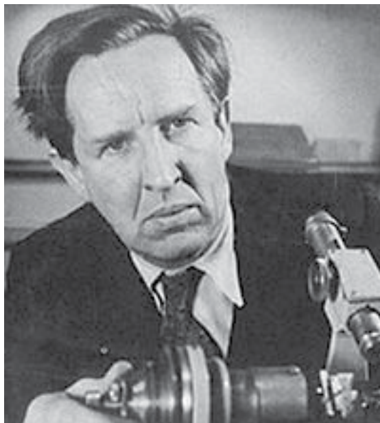
اعداد: د. صالح ياسر