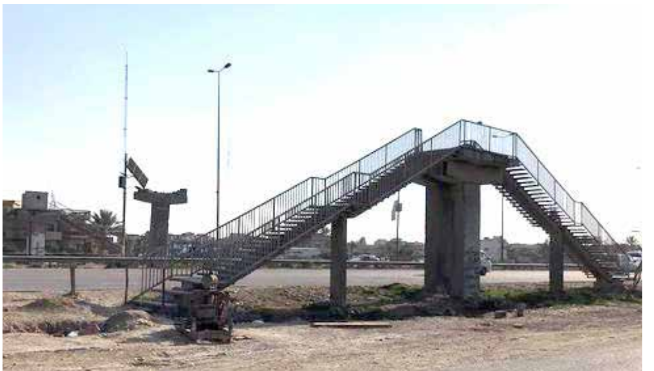
جسور المشاة خالية من العابرين

ويؤكد نعيم ان «الكثير من جسور المشاة على الطرق السريعة، طالها الضرر بسبب المركبات الكبيرة، وبالتالي تم رفعها من دون استبدالها بجسور اخرى، تضمن سلامة العبور الى المواطنين». ويجد رجل المرور أن هناك «ضرورة ملحة لإعادة اعمار جسور المشاة وبناء جسور اضافية، تتناسب مع متطلبات الشارع الذي بات مزدحماً، لكي نضمن سلامة العبور، فضلا عن مظهرها