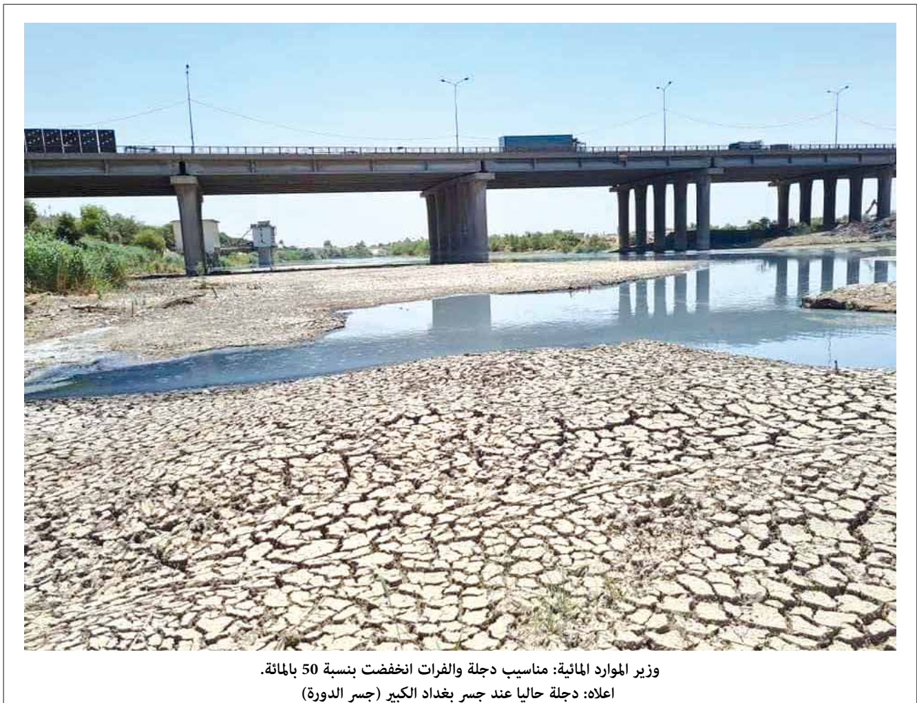
وزير الموارد المائية: مناسب دجلة والفرات انخفضت بنسبة 50 بالمائة. اعلاه: دجلة حالياً عند جسر بغداد الكبير (جسر الدورة)