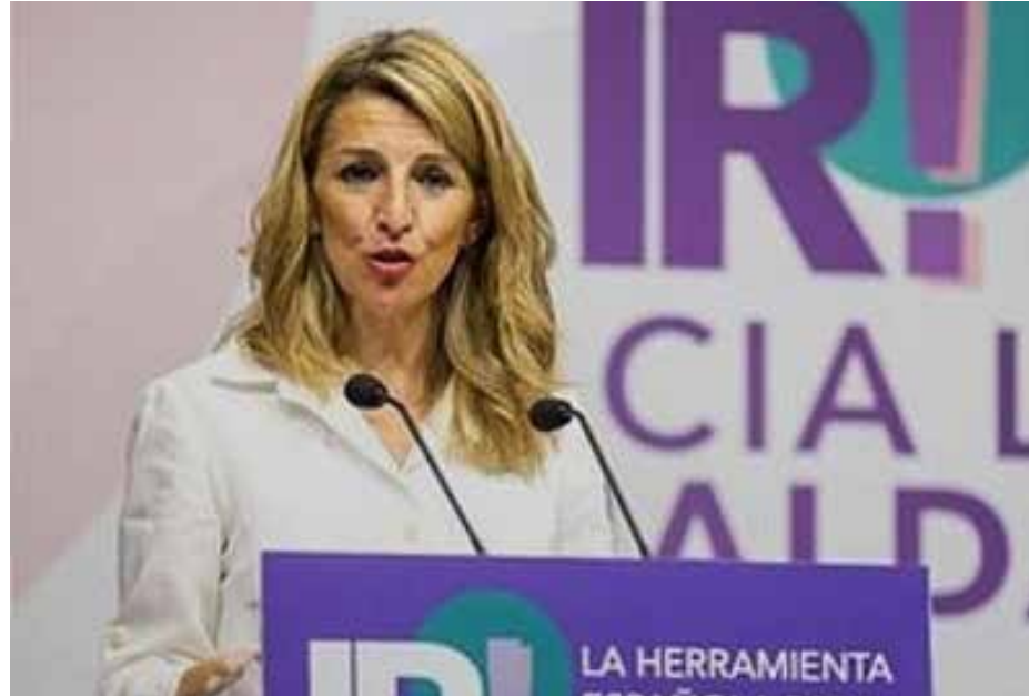
يولاندا دياز بيريز رئيسة تحالف اليسار الإسباني

بعد الإعلان عن اجراء انتخابات مبكرة في منطقة مدريد، استقال مؤسس وزعيم حزب بودوموس اليساري بابلو إغليسياس من منصبه كنائب لرئيس الوزراء ووزير للشؤون الاجتماعية، ليقود قائمة تحالف اليسار في انتخابات مدريد، أملاً هزيمة تحالف اليمين واليمين المتطرف. وقد حاول الائتلاف مع تحالف "مزيدا لمدريد" اليساري المحلي، لكن جهوده لم تتكفل بالنجاح، نتيجة لخلافات في انتخابات سابقة على الأدوار والحصص. وقد تميزت الانتخابات باستقطاب