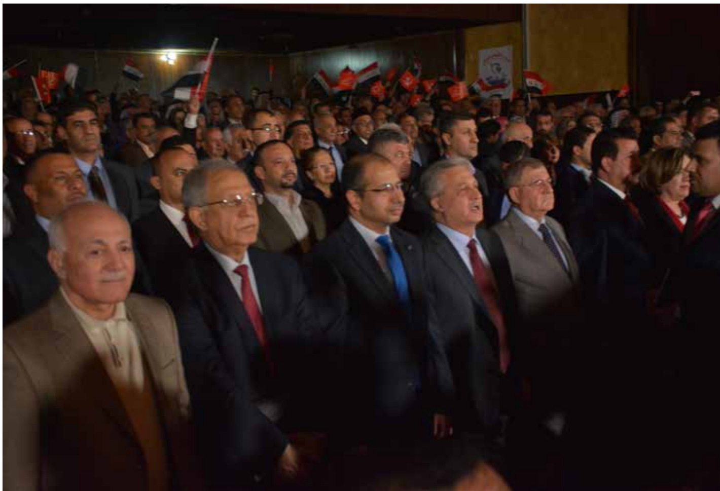
جانب من افتتاح المؤتمر الوطني العاشر

2 - وفي المادة (2) ((شروط العضوية)): اقترح اضافة كلمة ((ينشأ)) إلى الفقرة (2) من