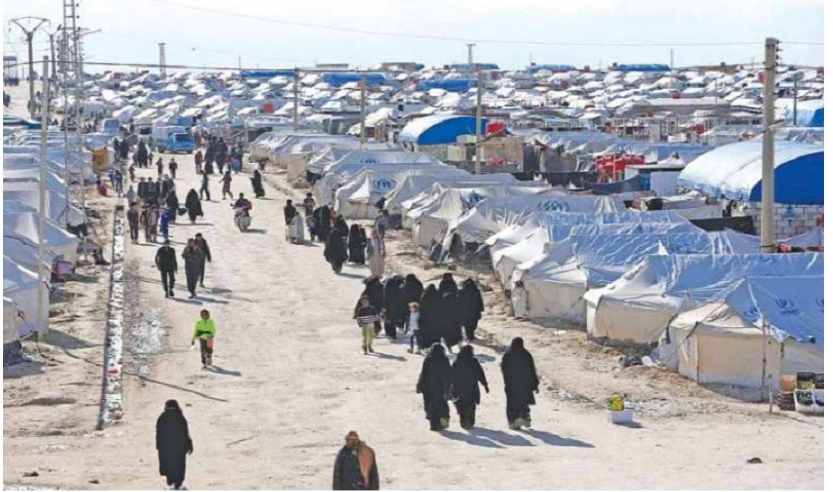
مخيم الهول السوري

المئات فقدوا حياتهم في ثورة تشرين واخيراً وليس اخيراً الشهيد إيهاب الوزني فضلاً عن الاعداد الكبيرة من المصابين ولم تتمكن الدولة من الوقوف على الجناة العابثين بالقواعد القانونية الآمرة المعطلين لوظيفة القانون المنتهكين لاحكام الباب الثاني من الدستور المتعلق بالحقوق والحريات رغم ان الدستور كرر على مسامح الدولة مفردة (تكفل الدولة ...) وبحدود الـ (12) مرة والمبتوثة في ثانياً نصوصه الا انها تراخت في اعمال هذه الكفالة او تلك وتركت للعابثين يسحبون الوضع الى مرحلة ما قبل الدولة وهم يوصلونا الان الى مقولة الفقيه (بسويه) القائلة : (فالكل سيد وحيث ان الكل سيد فالكل عبيد) .