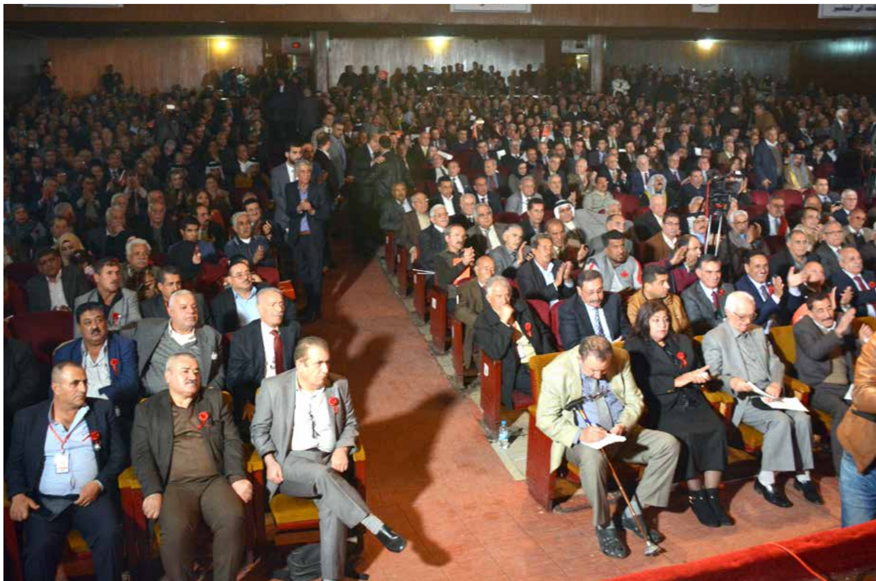
جانب من افتتاح المؤتمر العاشر