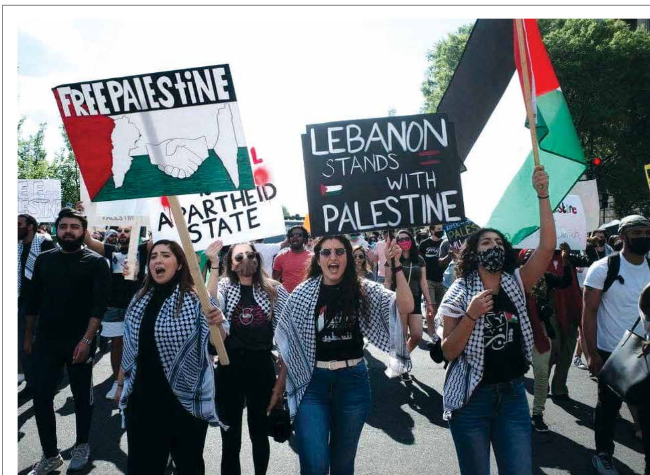
مظاهرة حاشدة أمام مبنى الكابيتول في واشنطن، انتصاراً لفلسطين ورفضاً للعدوان الاسرائيلي