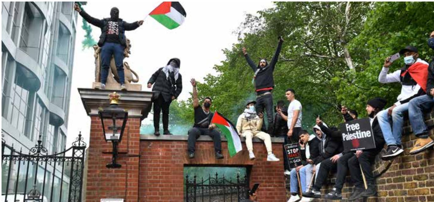
تظاهرة تضامنية مع فلسطين-لندن

وفي مدينة تعز اليمنية خرجت تظاهرة نصره للأقصى وغزة، حمل فيها المشاركون صور الأقصى ولقائات وهتفوا