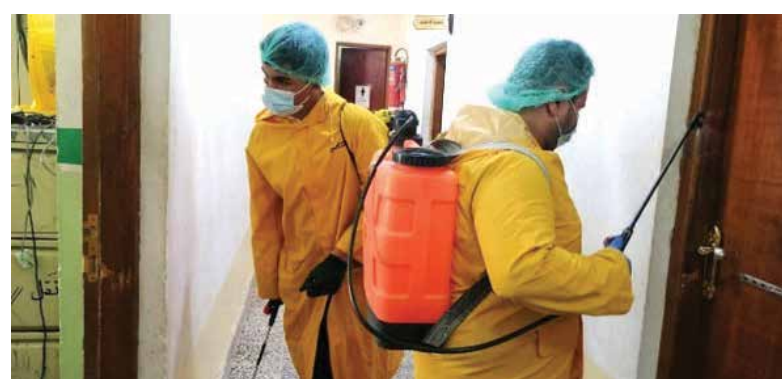
جانب من حملات التعقيم التي أجراها "منتدى النجف" في مبان حكومية

انعدمت الزرعة وتوقفت المصانع عن الدوران فبتنا نستورد قنينة ماء الشرب ، وتدهور التعليم وارتفعت نسبة البطالة وتفاقمت الأزمات المتتالية ، مع كثرة الأمراض والأوبئة التي تفتك بالناس! أصبح العيد بلا طعم ولا لون ولا نكهة أبدا ، غابت الفرحة والضحكة والإلفة وأيام اللعب والمرح وليالي السمر والحكايات ، فصرنا نتبادل التهاني الجاهزة صورياً والجمادة شعورياً بلا أدنى إحساس بالفرح والسعادة - إسقاط فرض فقط -! أعيدنا لم نشعر بها لكثرة الطعنان والنكبات والأحزان، حيث النفوس اعتلاها الصدا ، وعبثت بعض الأفكار بها فاندفع مفهوم التسامح وضاعت المحبة في مهبط الأقاويل والأراجيف! يا للعيد الذي يأتي ويذهب دونها طعم ، ويا للأزمان ، كيف تدور وتلفن بعجلتها عندما يُترق من نفوسنا الفرح ؟!