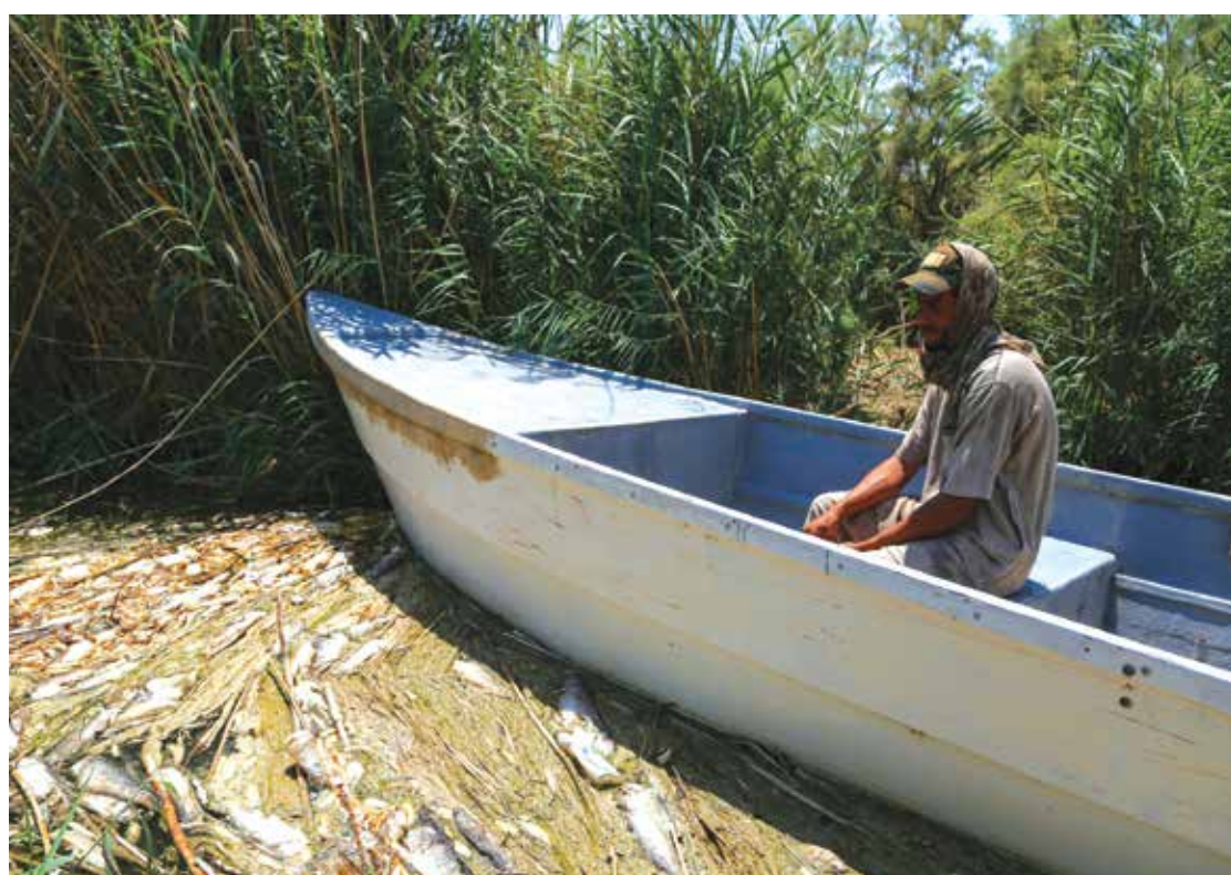
الاهوار ثروة العراق الكبيرة تحظى باهتمام دولي

وبدلاً من أن يجد المطالبون أذانا صاغية لمطالبهم المشروعة وانصافهم ومنحهم حقوقهم في العمل والعيش الكريم، لاقتهم هراوات وعصي أجهزة الأمن ولاحتقتهم ونالت من تجمعهم. نجدد التأكيد بأن السير على ذات النهج الذي استخدمته