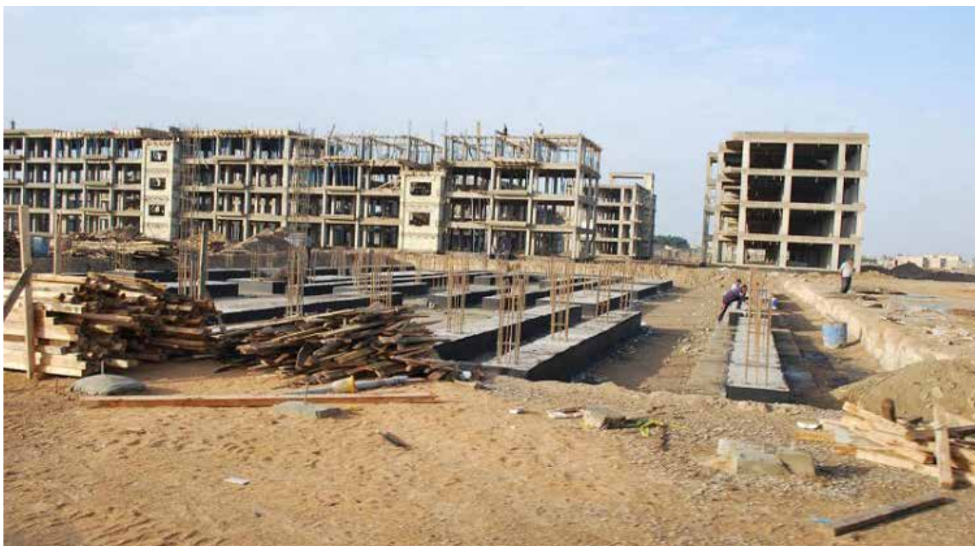
موازنة العام 2021 تخلو من التخصيصات الكافية للمشاريع الاستراتيجية

لم تخرج موازنة 2021 عن ارتها التاريخي، فهي استنساخ لما درجت عليه الموازونات العامة في العراق منذ عام 2004 التي لا تختلف احداها عن الاخرى سوى في الارقام التقديرية للإيرادات العامة والنفقات العامة. إذ لا يمكن توصيف موازنة 2021 بالموازنة الإصلاحية فهي من نمط الموازونات التقليدية التي تعتمد على الأبواب والبند، إذ تركز على تحقيق الإيرادات دون أي اعتبار للتخطيط المتوسط أو طويل الأجل، ولا يتم فيه تقييم عوامل الإنتاجية والأداء، أما النفقات العامة فلا تحدد في ضوء الآثار المترتبة عليها بسبب عدم التركيز على الاستخدام الأمثل لهذه الموارد، مما يؤدي إلى وجود هدر في هذه الموارد، بمعنى آخر أن نظام الموازنة العامة في العراق وتحقيق الإيرادات يركز على القواعد والإجراءات واللوائح أكثر من تركيزه على الكفاءة الاقتصادية. وهذا يعني أن الموازونات العامة في العراق تقوم بنيتها على أساس أن النفقات العامة تصنف إدارياً، أي أن النفقات العامة توزع على الدوائر والوزارات التي تدخل موازنتها في الموازنة العامة على شكل اعتمادات أو مخصصات سنوية، ثم تُصنّف هذه المبالغ السنوية التي تخصص لكل وحدة إدارية في شكل نوعي، ووفق الغرض من النفقات التي تسمى بنود الإنفاق أو مواد الإنفاق وغالباً ما تكون متشابهة.