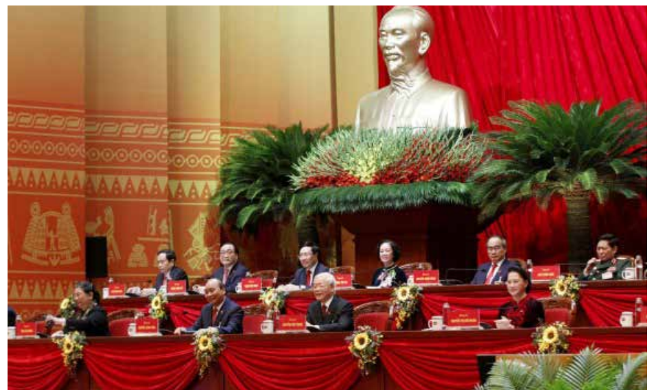
في افتتاح المؤتمر

تُختتم في هانوي اليوم اعمال المؤتمر الوطني الثالث عشر للحزب الشيوعي الفيتنامي بعد ستة ايام من انطلاقه وعقدت اللجنة المركزية أمس اجتماعها الأول لانتخاب المكتب السياسي والأمن العام والسكرتارية. ويضم المكتب السياسي المنتخب في عضويته رئيس الوزراء نغوين شوان فوك.. وكانت الأفاق الاقتصادية في صلب مناقشات المؤتمر الذي يرسم السياسات الرئيسية للبلاد للسنوات الخمس المقبلة.