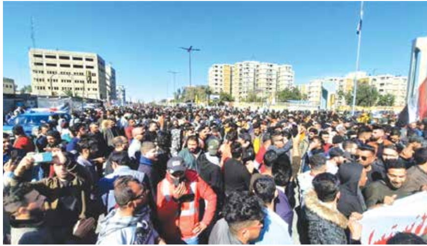
احتجاجات (علاوي الحلة) يوم امس انتهت بالاعتداء على المحتجين

قال مستشار حكومي، يوم أمس، إن الرقابة الدولية على الانتخابات لا تعني الاشراف عليها أو إدارتها، على أثر تصريحات لقوى متنفذة اعتبرت الرقابة الدولية «اشرافاً» يؤثر في سير العملية بشكل كبير. وفيما اعلنت مفوضية الانتخابات عن إجمالي عدد الأحزاب والتحالفات السياسية، التي تقدمت للمشاركة الانتخابية، اكدت تقديمها طلبات عديدة للرقابة الدولية، قوبلت بترحاب واستعداد تام. وتستمر ازمة المحكمة الاتحادية ومحاولات تأجيل حسمها، بحثا عن مخرج جديد، قد يعرض الانتخابات الى تأجيل آخر.