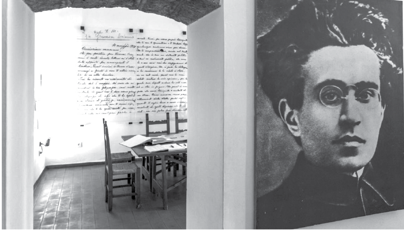
غرامشي والبيت الذي ولد فيه في مدينة غيلارزا

ويؤكد غرامشي أن قدرة أي طبقة اجتماعية على الصعود وتحقيق الهيمنة على المجتمع تكمن في قدرتها على تكوين مثقفين عضويين مرتبطين بها، وكذلك في قدرتها على استيعاب المثقفين التقليديين.