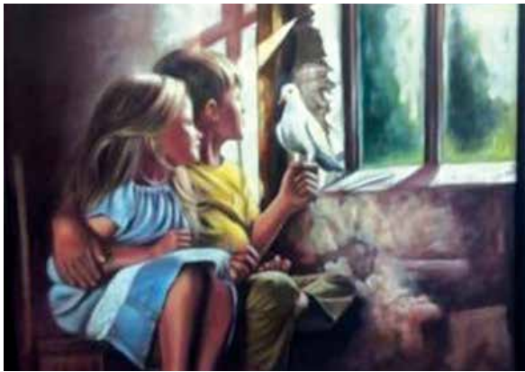
من اعمال المعرض

لا يزال المعرض التشكيلي النسوي الذي افتتحه فرع جمعية التشكيليين العراقيين في نيوي، يوم 6 كانون الثاني الجاري، مشرعا أبوابه أمام الزائرين. ويضم المعرض، الذي افتتح على قاعة الجمعية وسط مدينة الموصل، تحت عنوان "زهرات الموصل يشرقن لونا"، 29 لوحة لـ 29 فنانة تشكيلية. وحملت الأعمال موضوعات مختلفة، بعضها مثل تجارب جديدة بلغة تشكيلية تعبر عن عمق معاناة الإنسان، وبعضها الآخر جسد رموزا وتعبيرات موصلية متداولة، وسردا جماليا يتناسب مع وظيفة المرأة في الحياة. فيما طغى على عدد من اللوحات، طابع استعادي وهوية استذكارية. كما اتسم بعض الأعمال، بطابع شعري عبر توظيف الخط واللون في تدوين الأمنيات والأحلام ومشاعل الحياة.