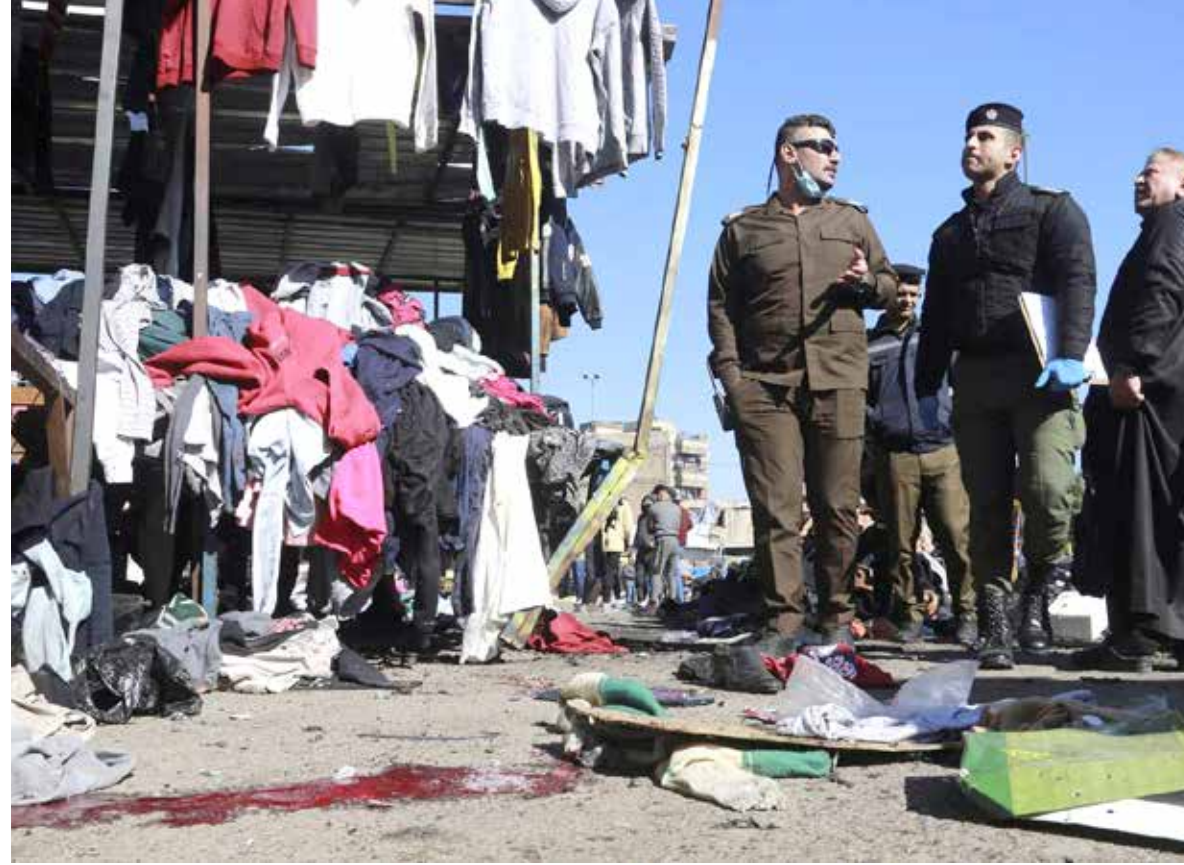
مطالبات واسعة بضبط الامن ومحاسبة القتلة والمجرمين

ولاقى التفجير الارهابي، إدانات عربية ودولية واسعة من قبل السفارات والحكومات والمنظمات. وأصدر الأمين العام للأمم المتحدة، أنطونيو غوتيريش، بيانا دان التفجير، داعيا الحكومة الى «تحديد هوية من يقف وراءه»، فيما تواتر بيانات الادانة من سفارات وحكومات ومنظمات عديدة منها، تركيا، لبنان، تونس، فلسطين، الولايات المتحدة الامريكية، الاردن، قطر، اليمن، كندا، إيران، مجلس التعاون الخليجي، البرلمان العربي،