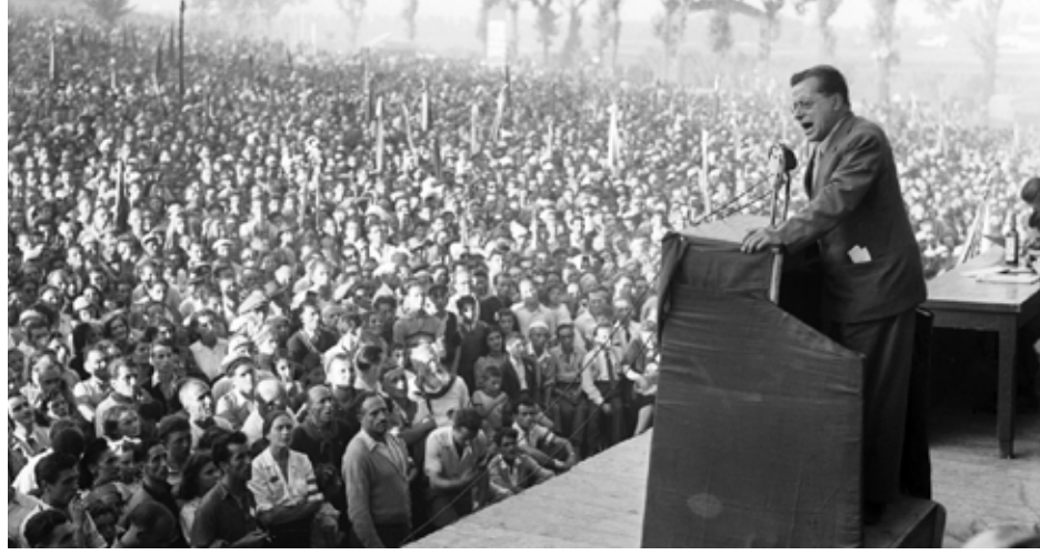
القائد الشيوعي تولياتي في عام 1947

تماماً عن "الطريق الإيطالي للاشتراكية" وإرث غرامشي وتولياتي. وفي شباط 1991، تم كسر الجسور مع الماضي الشيوعي، وتم حل الحزب رسمياً، وأُسست الأكتية الحزب الديمقراطي، الذي عد نفسه يسارياً، ولكن سرعان ما انتقل إلى مواقع الوسط، وبدأ يتبنى سياسات بين الأحزاب الديمقراطية الاجتماعية، وهوارة ذلك تأسس (الحزب الشيوعي الإيطالي إعادة التأسيس)، الذي أضاف إلى اسمه قبل سنوات (اليسار الأوربي). انشقت منه لاحقاً مجموعة باسم حزب الشيوعيين الإيطاليين. لم يخفف