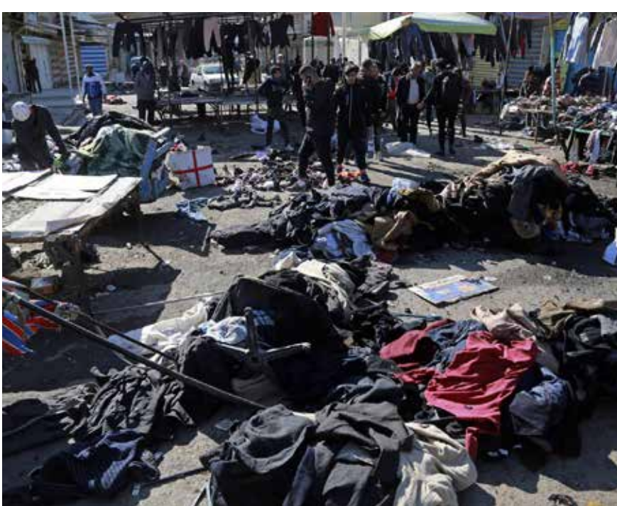
ما تبقى من بضاعة الكسبة في تفجير الخميس الدامي

وتسائل علي خلال حديثه لـ"طريق الشعب"، عن "دور القوات الأمنية التي يفترض أن تحمي منطقة تعج بالفقراء والكادحين ومحدودي الدخل"، لافتا الى أن دماء الأبرياء "ستسسى تماما وسط دوامة الصراع السياسي وسباق المناصب والنفوذ، كما نسبت دماء الآلاف من المتظاهرين السلميين، في شكل يدلل على إهمال القوى المنتفذة الحاكمة لأرواح المواطنين".