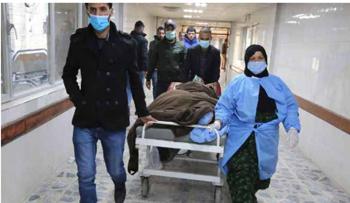
مطالبات بمعالجة الجرحى وتعويض عوائل الشهداء

وشدد التيار الديمقراطي على وفق بيان تلقته "طريق الشعب"، على أن "السلاح المنفلت هدد الأمن الداخلي وشجع القوى الإرهابية المندحرة للتحرك من جديد مستهدفة أمن وسلامة واستقرار المواطنين"، مبيناً أن "الانشغال بالصراعات السياسية ومحاولات الالتفاف على إجراء الانتخابات المبكرة تحت مظلة الفساد قد دفع القوى الطائفية الإجرامية الى أن تستفيد من الفراغ الأمني، وتعود من جديد إلى أساليب التفجيرات لغرض إشعال فتنة طائفية جديدة، وكسر التوجهات نحو الوحدة الوطنية".