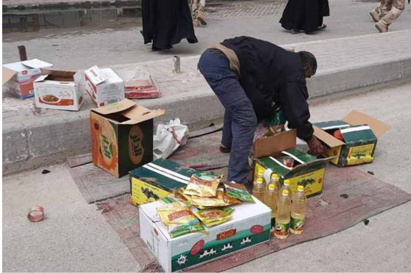
تفاصيل اخرى على الصفحة السادسة