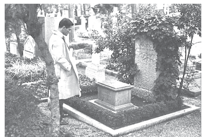
المخرج السينمائي والكاتب الإيطالي باولو بازوليني أمام ضريح غرامشي في روما

ومن مآسي الأقدار أن ينتزع هذا المفكر العظيم من من دفء الحياة ومجرى الكفاح الفكري والسياسي ليلقى به في عزلة السجن وظلامه. ومما له دلالة أنه كتب