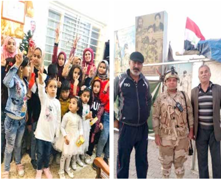
في مدينة الثورة