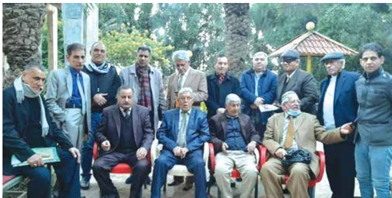
من وجوه الناصرية الثقافية والوطنية