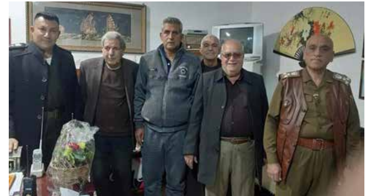
ناحية بهرز في محافظة ديالى

وفي السياق، أقام "منتدى الأم والطفل" التابع إلى اللجنة المحلية للحزب في مدينة الثورة (الصدر)، حفلاً عائلياً في مناسبة حلول أعياد رأس السنة وعيد الجيش العراقي.