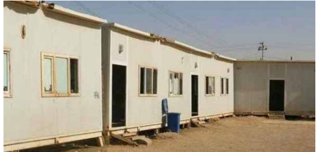
متى يتخلص العراق من مدارس الطين والكرفانات؟

المدارس». وأشار إلى "تسليم الدعوات للشركات الصينية من خلال الطرق الدبلوماسية، واستكمال الإجراءات الإدارية والفنية لتوقيع العقد معها". وأكد أن "الحكومة العراقية جادة في الإسراع لانطلاق المشروع وتوقيع العقد مع الجانب الصيني، خلال الأسبوعين المقبلين، بعد المصادقة على اختيار العقد المناسب للتنفيذ، على وفق التصميم التي وضعها المركز الوطني للاستشارات الهندسية في وزارة الإعمار والإسكان والبلديات والأشغال العامة"، مبيناً أن "المعايير التي ستستخدم في بناء المدارس، هي الكثافة السكانية والحاجة